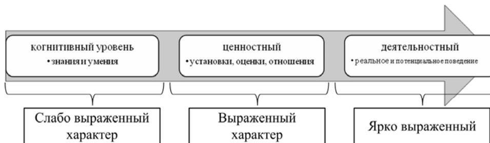
Рис. 1. Уровни медиакультуры учителя Fig. 1. Levels of the teacher's media culture

По степенности выраженности показателей медиакультуры учителя определены три уровня их проявления (рисунок).