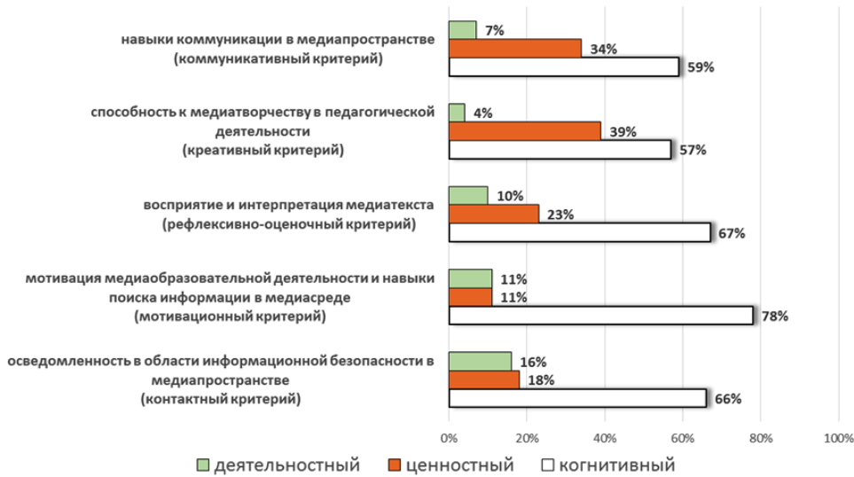
Рис. 3. Показатели оценки медиакультуры учителя в экспериментальной группе в начале эксперимента