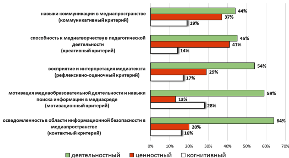
Рис. 5. Показатели оценки медиакультуры учителя в экспериментальной группе в конце эксперимента

странстве; увеличилось число учителей, позиционирующих себя как способных создавать и внедрять в педагогическую практику собственные медиапродукты.