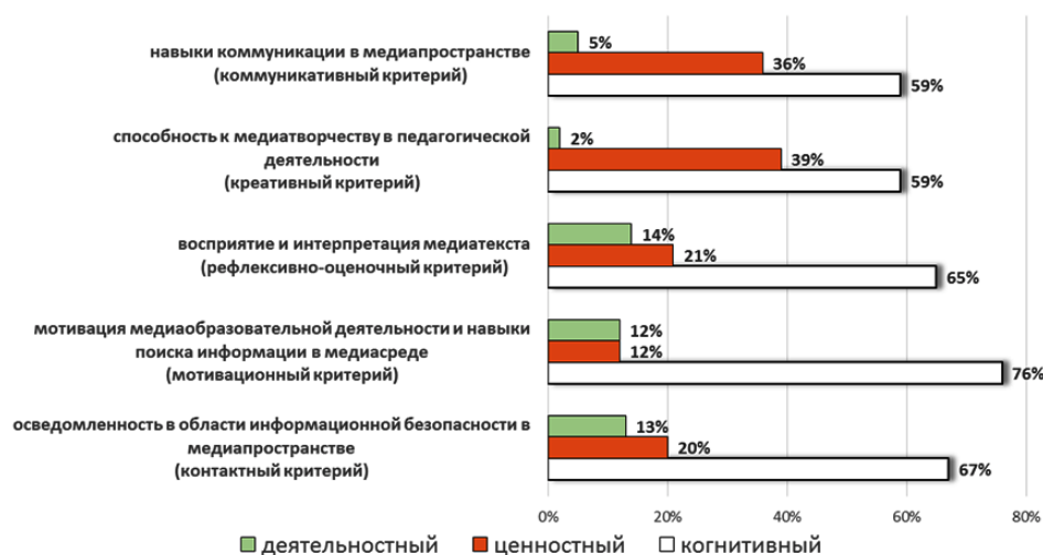
Рис. 2. Показатели оценки медиакультуры учителя в контрольной группе в начале эксперимента

Распределение учителей по уровням медиакультуры в КГ и ЭГ в начале эксперимента представлено на рис. 2 и 3 соответственно.