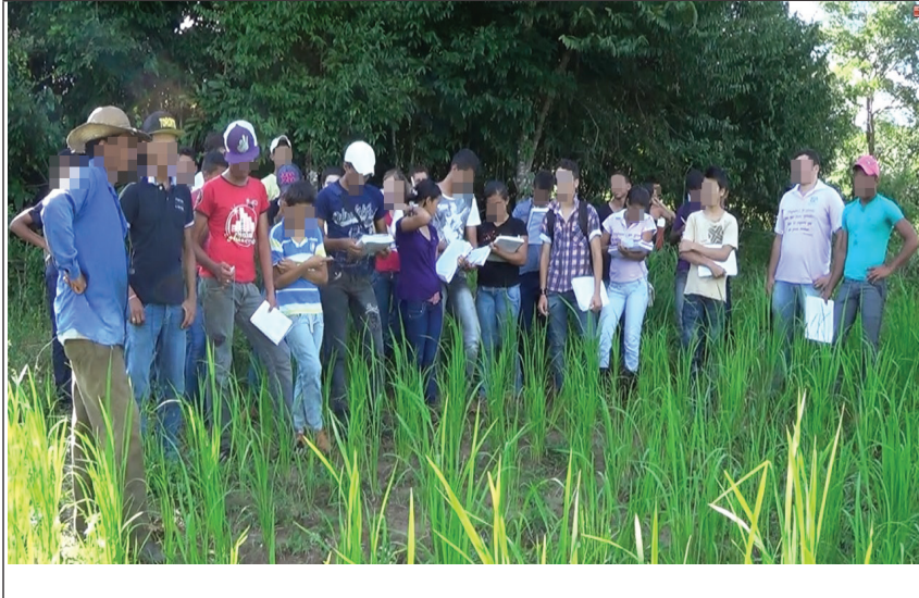
Figura 4. Visita de estudo – PE Agricultura familiar 25