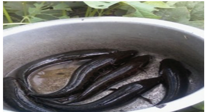
Figure 1: Poisson serpent ( Parachana insignis )

Le matériel animal de cette étude a été constitué des poissons serpents de l'espèce P. insignis (Sauvage, 1884), souche non identifiée dont les alevins ont été collectés dans des plans d'eau naturels. Ces espèces sont des poissons d'eau douce ayant le corps allongé et cylindrique, couvert d'écailles cycloïdes. Elles ont une coloration noirâtre très foncée, marbrée d'ocre clair avec la zone ventrale plus claire. Il y a 5 à 8 taches sombres de forme plus ou moins arrondie sur les flancs. Il existe également des petites taches sombres formant des bandes obliques plus ou moins visibles sur les nageoires. Les alevins ont une coloration générale ocre avec une bande noire latérale ou milieu du flanc, allant de l'extrémité du museau jusqu'à l'extrémité de la nageoire caudale (Musibono, 2013). Ces espèces ont un organe respiratoire accessoire qui leur permet de vivre dans des environnements hypoxiques boueux (Olaosebikan et al. , 1998). L'organe de respiration accessoire est présent sous forme de deux cavités pharyngiennes suprabranchiales, permettant de respirer directement l'air atmosphérique (Musibono, 2013).