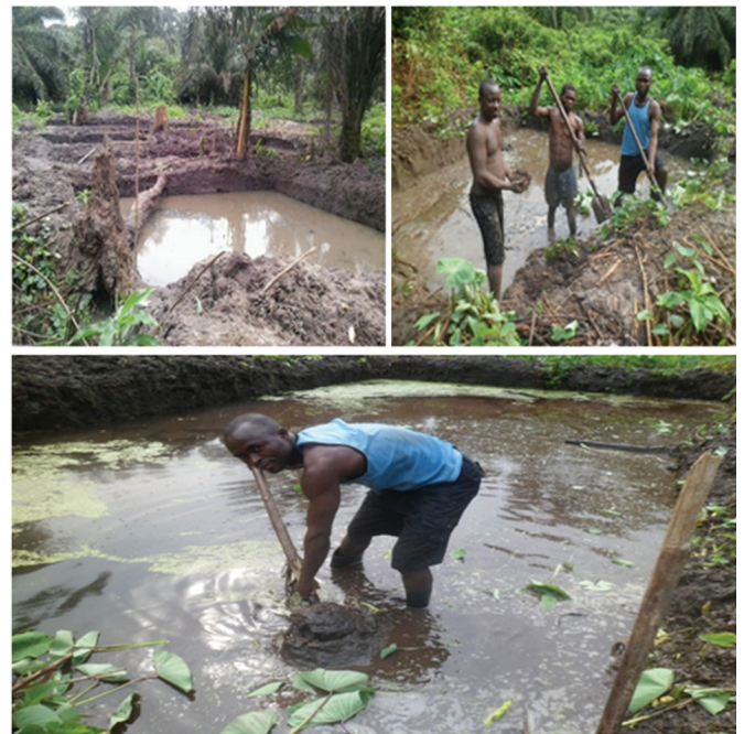
Figure 2: Aménagement des étangs piscicoles

L'un des principaux défis à la domestication de cette espèce étant l'absence de dimorphisme sexuel externe (Kpogue et al. , 2013). Ce qui a fait que le système de pisciculture soit celui de l'élevage de P. insignis en monoculture, en sexes mixtes. Le dispositif expérimental adopté est celui de blocs complètement randomisés, à un facteur à deux niveaux, avec un bloc ayant à chaque fois les deux traitements répartis au hasard dans deux répétitions. Les poissons ont été élevés dans 4 bassins piscicoles ayant une superficie moyenne de 0,5 are. Le son de riz combiné à la fertilisation minérale des étangs a constitué les différents traitements appliqués: T_0 ou témoin (les étangs ont été traités comme à l'accoutumée dans la région, c'est-à-dire ne recevant ni fertilisant ni aliment) et T_1 (étangs traités avec l'engrais NPK 17-17-17 combiné au son de riz). La mise en charge a été faite à la date du 29/05/2018 avec 11 poissons (fingerling) de P. insignis d'un poids moyen de 22 g/étang.