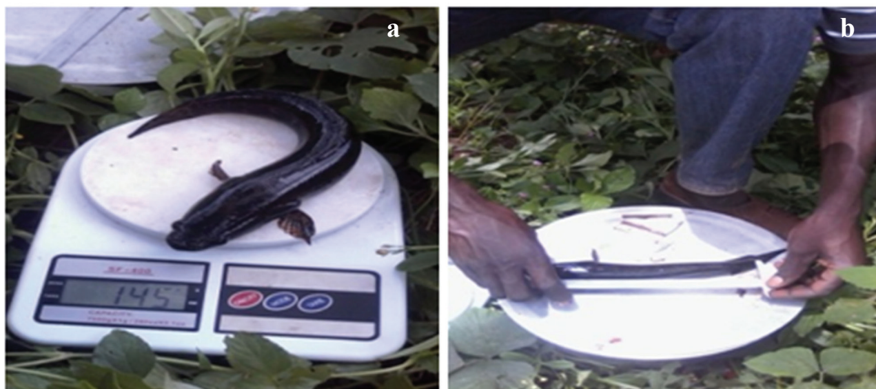
Figure 3: (a) Balance électronique et (b) pied à coulisse

Il ressort des figures 4 et 5 que les paramètres physico-chimiques mesurés varient dans les limites de tolérance de P. insignis . Le pH a faiblement varié entre 5,5 et 6,5 : zone légèrement acide mais correspondant aux exigences de cette espèce car pour la plupart d'espèces des poissons aquacole, la gamme de pH optimum est de 6,5-9,0 (Boyd, 2012). En se référant aux données sur la température de