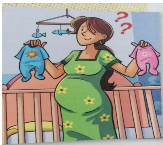
Figura 3 – Apresentação de cores para meninos e meninas.

“Atividade 9. Leia as frases: “meninos são corajosos e fortes. Meninas são sensíveis e comportadas”. Você acha correto generalizar sobre comportamentos e personalidades dos gêneros masculinos e femininos?” (L3. Col3/8º, p. 52º).