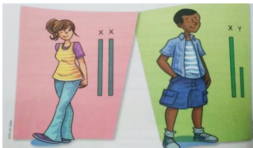
Figura 2 – Apresentação de cores para meninos e meninas. Fonte: L.3 Col.2/8º, p.248.

performances de gênero: reforços aos estereótipos de gênero nas imagens publicadas dos livros; mas, trazem também, questionamentos sobre esses padrões estabelecidos. Vejamos: