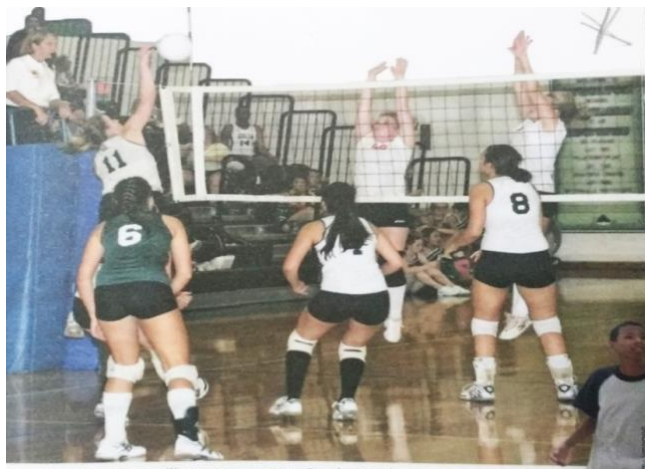
Figura 6 – Mulheres praticando esporte.

O livro do 8º ano da 3ª coleção apresenta uma discussão bastante interessante em forma de texto e atividade sobre identidade de gênero e orientação sexual, fazendo uma diferenciação e explicando de forma evidente do que se trata tais denominações.