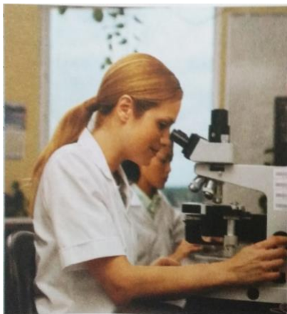
Figura 4- Representação da mulher cientista.

algumas imagens e trechos que permitem visibilizar a discussão de gênero e sexualidade numa perspectiva inclusiva, respeitosa e cidadã: