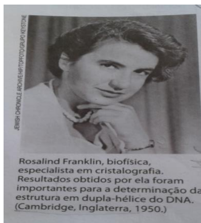
Figura 5– Imagem da cientista Rosalind Frankli.

A representação da mulher na Ciência e a abordagem nos livros didáticos de Ciências sobre os nomes femininos de destaque mundial nas pesquisas científicas são recursos importantes para que possam servir como exemplificação didática de que mulheres e homens têm as mesmas possibilidades e podem construir ciência de qualidade independentemente de gênero, etnia, orientação sexual ou credo religioso, por exemplo. Trazer esses fatos nos livros didáticos promove um movimento positivo em alunos e alunas para reconhecerem que a história não foi construída apenas por cientistas homens e suas vitórias, mas também por mulheres nas mais variadas áreas da Ciência.