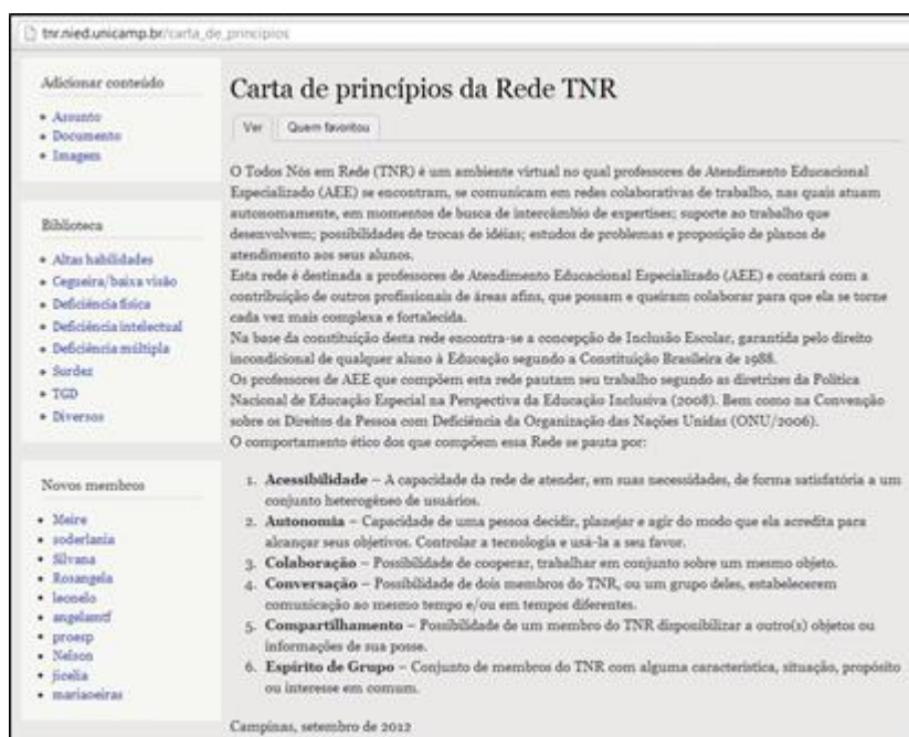
Figura 4 - A Carta de Princípios da rede TNR