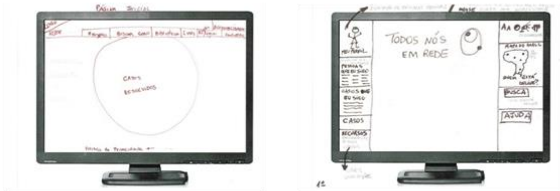
Figura 2 - Design participativo dos professores na criação do sistema TNR.