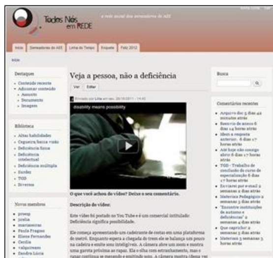
Figura 3 - A primeira versão da página inicial do TNR (publicada em 2011)