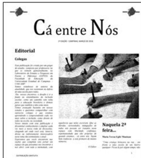
Figura 8 - Primeira edição em papel do “Cá entre Nós” (março de 2018)