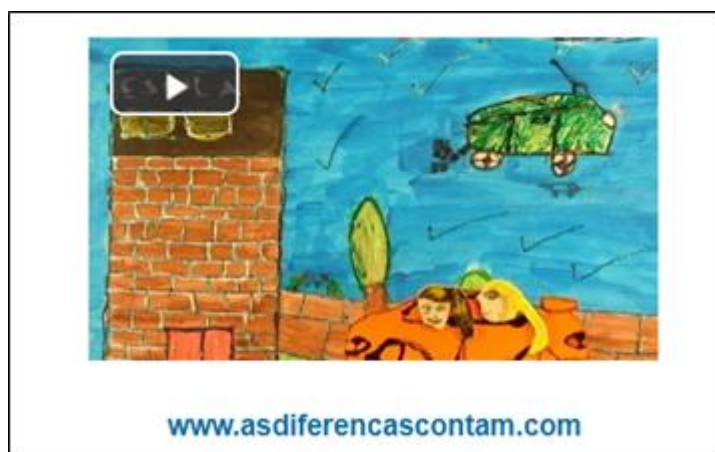
Figura 7 - Animação feita por alunos do sexto ano do PRODECAD/UNICAMP para estudo do tema: “Acesso de todos os alunos à escola”

Exemplo de atividade do curso: Práticas Educativas inclusivas: As diferenças contam