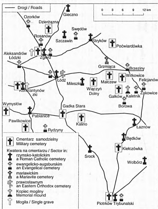
Rys. 1. Wojskowe miejsca pochówku z okresu I wojny światowej w okolicach Łodzi

(RÓŻYCKI 1936). The battle was not limited to the Brzeziny region, but included all movements of the German 9 th army and the Russian 1 st , 2 nd and 5 th armies around Łódź (DĄBROWSKI 1937) from Piotrków and Będków in the south, through Pabianice, Konstantynów and Aleksandrów in the west, to Stryków, Zgierz and even Ozorków in the north. One result of Operation Łódź was the division of the region into two occupation zones: German and Austrian, with the border running to the north of Piotrków and Wieluń.