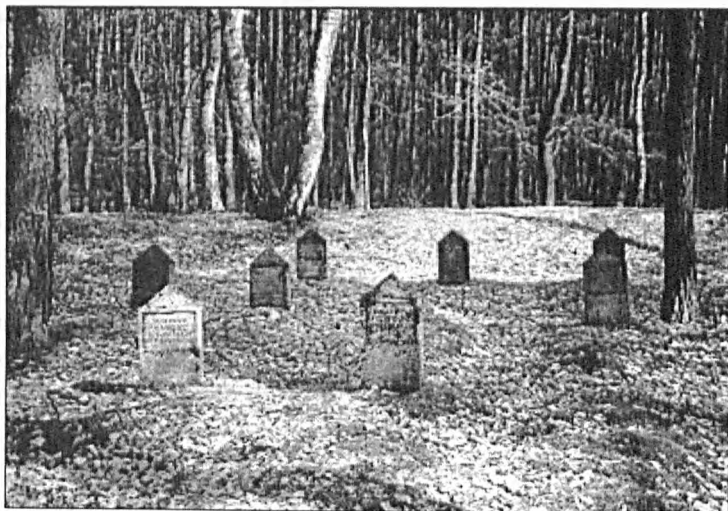
Fot. 2. Cmentarz w Wymysłowie

Photo 1. The cemetery in Kielczówka