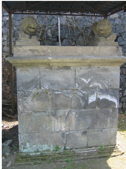
Fig. 2. Pompeya. Monumentum familiar de los Stronnii , en la necrópolis de Porta Nocera.

do últimamente para definir fronteras étnicas prerromanas con exactitud. 13 Incluso en estos territorios el principal impulso de este tipo de manifestaciones funerarias llamadas tradicionalmente “tardoibéricas” se centraría sobre todo en los siglos II-I a.C., siguiendo asimismo los modelos romano-italicos, incluso en esquemas que tradicionalmente se habían vinculado al mundo ibérico, como el del león con la cabeza humana bajo una de las garras. 14 Desde el punto de vista tipológico se remite especialmente al modelo expresado en la tumba tardorrepublicana de la familia Stronnia , localizada en la necrópolis de Porta Nocera, en Pompeya ( Fig. 2 ), donde dos leones, de tipo naturalístico y con una de las zarpas sobre una cabeza de carnero, coronan los flancos superiores de una tumba “a dado”; es decir, de una cámara sepulcral exenta, elaborada en opus quadratum y con forma cuadrangular o de dado.