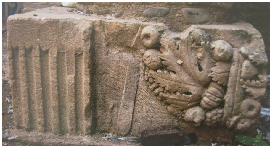
Fig. 7. Bloque con relieves de carácter funerario, de un monumentum de Colonia Patricia Corduba (Córdoba).

exacta. 47 Del estudio que hemos hecho de los dibujos y descripciones del siglo XIX y, sobre todo, del análisis de las inscripciones de las urnas podemos pensar que la tumba familiar estuvo en uso en época augustea, incluso que fuera construida entonces o –en todo caso– en un momento muy poco anterior.