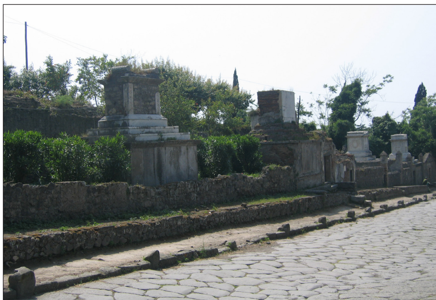
Fig. 1. Pompeya. Vista de la necrópolis de Porta Ercolano.

ca datable en el período preaugusteo, tanto desde el punto de vista de la arquitectura funeraria, cuanto de la escultura y epigrafía asociadas a aquélla. En efecto, prácticamente el material arqueológico que sustenta ese proceso en momentos tardorrepublicanos preaugusteos en la Hispania meridional lo constituyen las representaciones escultóricas zoomorfas, especialmente de leones, asociados o no a cabezas de carneros y humanas, como protectores de las tumbas y de las almas de los difuntos en el Más Allá. 11 Tradicionalmente se hablaba de un período tardoibérico en esa escultura zoomorfa, que ocuparía los siglos III, II y I a.C., pero con el grave error conceptual —a mi juicio— 12 de no tener en cuenta el trascendental cambio de tipo político que significa el que estos territorios meridionales pasen de forma efectiva bajo el control romano, sobre todo, tras la constitución de la provincia Hispania Ulterior en el 197 a.C.