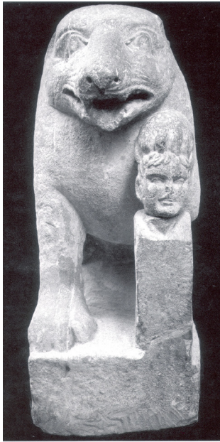
Fig. 3. “Oso de Porcuna”. Museo Arqueológico Nacional.

una inscripción en el frente de la base del grupo escultórico, aunque ahora sólo se identifican algunas letras latinas en capital cuadrada ( Fig. 4 ). 21