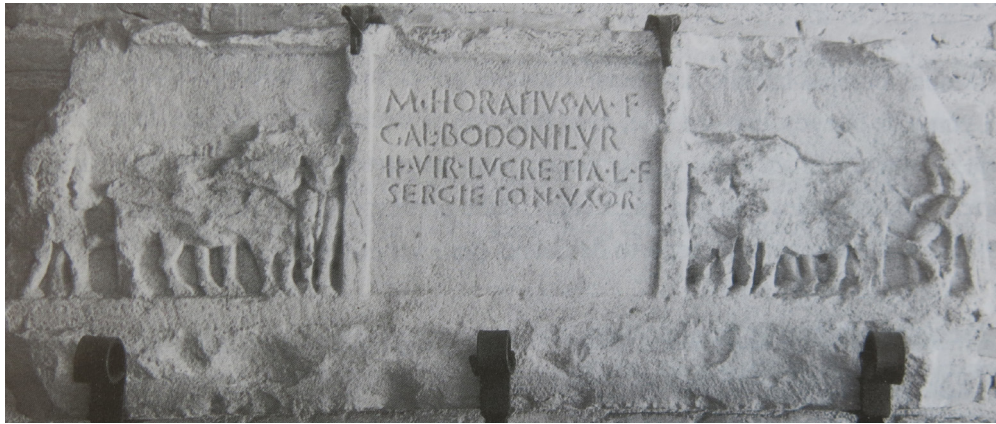
Fig. 10. Friso epigráfico de un monumentum de Urgavo (Arjona, Jaén). Palacio episcopal de Jaén.

pero no parece demostrable en el estado actual de la investigación, dados los pocos testimonios cordubenses y el enorme volumen localizado en estas necrópolis urbanas del alto Guadalquivir, así como a que también el arranque del fenómeno es coetáneo en ambas áreas en la época de Augusto. Por tanto, más bien pudo corresponder a influencias paralelas y coetáneas que vienen directamente desde la Península Itálica, como fruto de las nuevas presencias humanas foráneas y de los profundos cambios socioeconómicos que supuso la época de Augusto en ambos sectores, 54 que –tampoco debe olvidarse– corresponden a provinciae diferentes, pues el gran núcleo giennense se sitúa en la Tarraconense, al menos tras el desgajamiento del saltus Castulonensis de la Bética en momentos tardoaugusteos.