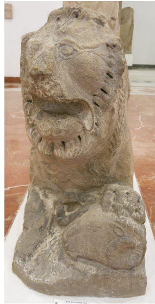
Fig. 4. León de Nabrisa (Lebrija, Sevilla). Museo Arqueológico Provincial de Sevilla.

En ese panorama el caso de Osuna, la antigua Urso , sigue siendo efectivamente excepcional, ya que incorpora junto a las figuras zoomorfas escenas con representaciones humanas. No obstante, en este caso, el conjunto de relieves funerarios, que formarían parte del exterior de monumenta –posiblemente turriformes en algún caso y con basamentos escalonados– y que fueron amortizados por la construcción de la muralla pompeyana ante el avance de César en el 45 a.C., debe ser datado por tanto con anterioridad a la constitución de la colonia Iulia Genetiva y a la época de Augusto. Ya he mantenido en un trabajo anterior que me parece todavía más acertada esa datación tradicional de la muralla, frente a otras hipótesis de considerarla de fecha republicana anterior o incluso protohistórica. 22 Desde el clásico estudio de Antonio García y Bellido en la década de 1940, con un enfoque luego mantenido y ampliado por otros autores, como Pilar León o Pedro Rodríguez Oliva en fechas más recientes, se considera que de manera excepcional existe en Urso una secuencia entre un conjunto de relieves tardoibéricos (s. III a.C.) y otros varios de época romano republicana, pero esa secuencia no puede establecerse de manera clara, dada la falta de