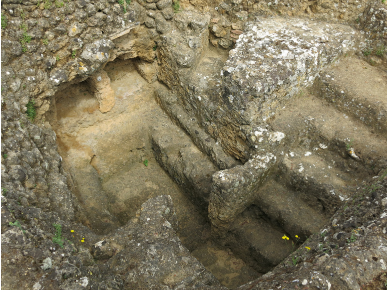
Fig. 5. Cámara hipogea de una tumba de la necrópolis occidental de Carmo (Carmona, Sevilla). Conjunto Arqueológico de Carmona.

datos e interpretación. 29 Más recientes son las excavaciones de la necrópolis oriental de Munigua , perfectamente planteadas desde el Instituto Arqueológico Alemán de Madrid, pero en ésta no se advierte una monumentalización sepulcral, con la excepción de un mausoleo, con sarcófagos en su interior, pero no de época augustea, sino ya del siglo II d.C. 30