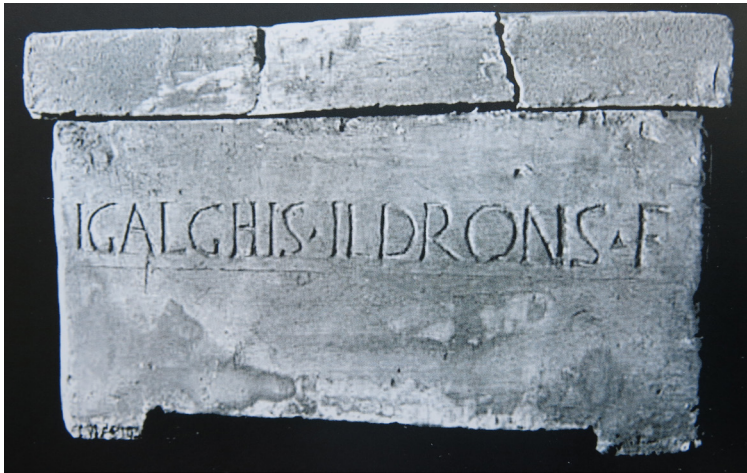
Fig. 8. Copia en yeso de la urna cineraria de Ildrons Velaunis (filius) , del “mausoleo de los Pompeyos” (Torreparedones, Baena, Córdoba). Museo Arqueológico Nacional, Madrid.