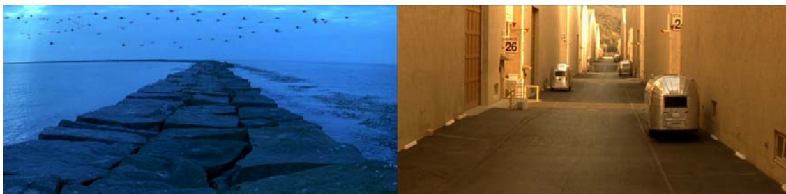
Ilustración III. Mundo ficcional vs. mundo factual: idénticas estructuras visuales.

Comienza Simone con la asociación de dos universos diferentes pero intersecados: la ficción del relato Amanecer atardecer y una calle de los estudios hollywoodienses donde se rodó, lo cual viene a resumir la esencia temática de la película: los universos ficcionales y el empírico son indisolubles porque se nutren entre sí, aunque dissociables porque operan de maneras bien distintas.