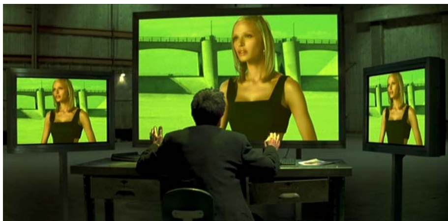
Ilustración IV. Estructura ternaria del Simulation One, como un tríptico de pintura sacra.

En efecto, desde su oráculo cinematográfico, Taransky ha engendrado un ser de enorme trascendencia social y mediática, dimensiones éstas, a mi entender, indisociables del individuo en la era comunicativa. En el plató, por medio del sofisticado Simulation One, moldea su creación y dialoga especularmente con ella, no siendo Simone otra cosa que un ser creado a imagen y semejanza de su propia voluntad estética. Tal es el grado de presencia de lo mítico y religioso en la película, aspecto que ampliaré cuando me refiera a los lenguajes secundarios .