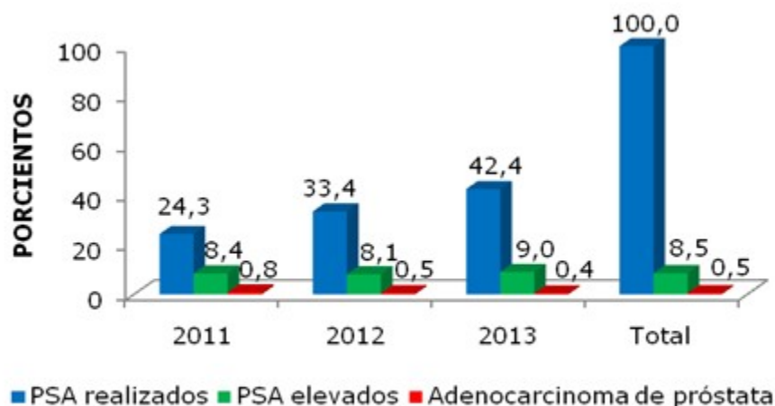
Gráfico 2. Rastreo de los resultados, relacionando los PSA realizados, los elevados y adenocarcinoma de próstata por año

los tres años, de estos pacientes examinados se demostró la presencia de adenocarcinoma de próstata en el 0,5 %. (Gráfico 2).