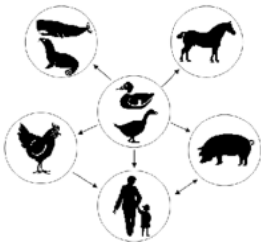
Sl. 1. Divje vodne ptice predstavljajo glavni rezervoar za viruse influence tipa. Od divjih ptic se virus lahko prenese na druge gostitelje, kot so prašiči, konji, domača perutnina, kiti in ljudje. Človek se lahko okuži tudi od perutnine in prašičev (povzeto po [5]).