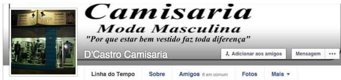
Figura 5: Perfil

A mudança de estratégias é necessária para que o administrador não tenha a compreensão de que as redes sociais não se aplicam a sua empresa, pois não conseguem atingir o público, também se faz necessária para trazer resultados positivos e não ser mais um investimento que não obteve retorno, muito pelo contrário, essas novas tecnologias estão disponíveis para auxiliarem a comunicação digital e permitir uma nova cultura organizacional nas empresas.