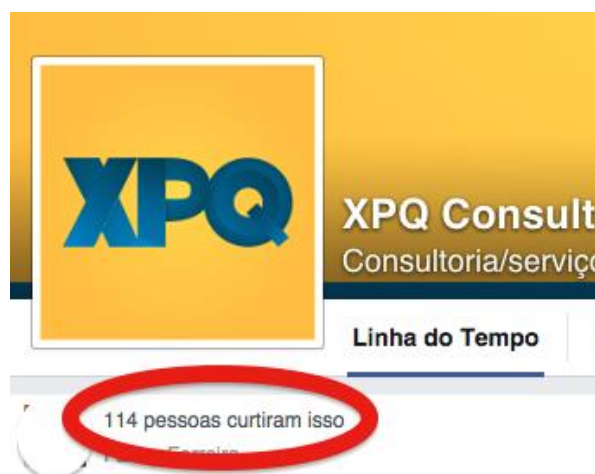
Figura 4: Baixo número de curtidas

confiança, fidelizando ainda mais o vínculo entre organização e público.