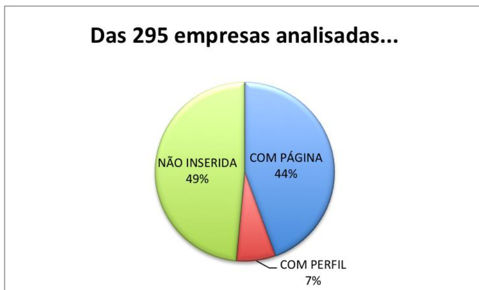
Figura 6: Mapeamento 2016

Com o propósito de identificar as transformações na conjuntura das organizações do município no intervalo de um ano, foi realizado novamente em 2016 o levantamento documental com a ACISB e executado o mapeamento das informações coletadas, os resultados revelam que houve mudanças no contexto das empresas de São Borja no ano de 2016: