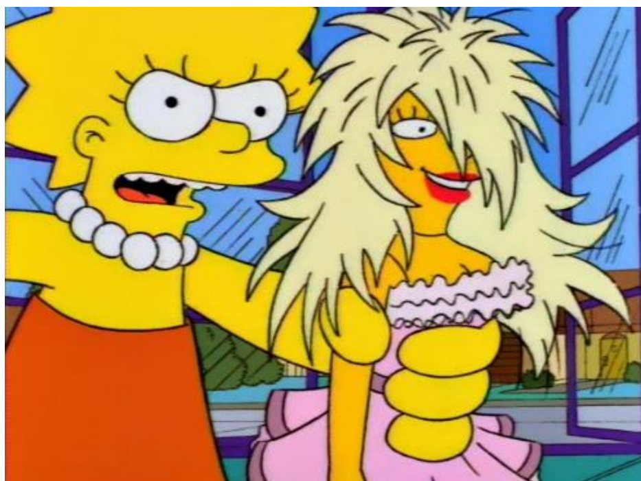
Fig.1 Lisa inconformada depois de ouvir a boneca falante

Depois de anos adorando a boneca Malibu Stacy, Lisa Simpson (a filha mais velha do casal Marge e Homer Simpson) se decepciona quando uma outra versão da boneca passa a ser comercializada. Isso acontece porque a nova Malibu é uma boneca falante que só reproduz frases machistas e ofensivas para a mulher. Logo que ganha a boneca, Lisa aguarda ansiosa pra ouvir o que sua boneca favorita tem a dizer e se depara com frases como “Vamos fazer biscoitos para os meninos!” “Quero que ensinem a fazer compras na escola.” “Meu nome é Stacy, mas podem me chamar de fiu fiu (onomatopeia para assovio) “Pensar demais vai me deixar com rugas”. Lisa, que se declara feminista, fica desesperada e chega a questionar a própria boneca, perguntando se a mesma não teria nada de relevante a dizer, já que menina esperou tanto por esse momento. E a boneca responde: “Não me pergunte! Sou apenas uma garota!”.