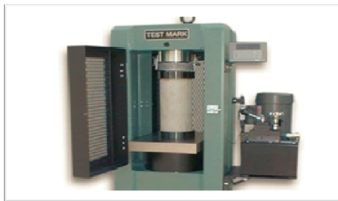
Gambar 1 Posisi pengujian kuat tekan beton

Pembakaran Beton dilakukan setelah selesai masa perawatan beton selama 28 hari, proses pembakaran beton dilakukan dengan cara dibakar langsung dengan api (Astari, N, 2015). Jumlah benda uji yang dibakar sebanyak 40 sampel, 20 sampel pada suhu 200 0 C dan 20 sampel pada suhu 400 0 C.