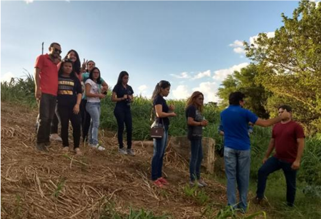
Figura 05. Visita técnica nas áreas de entorno das ETE junto aos gestores municipais.

Também, durante os trabalhos de campo, visitamos as áreas que têm potencial para reuso das águas, como as áreas de potencial agrícola no entorno das ETE, onde deverão ser cultivados o capim elefante ( Pennisetum purpureum Schum ) para servir de alimento para o gado e eventualmente algumas espécies frutíferas como a bananeira (fig. 06) e a área de lazer do município, já em zona urbana, onde se planeja gramar e arborizar promovendo o paisagismo e um microclima mais ameno através do sombreamento oriundo da arborização (Figura 07).