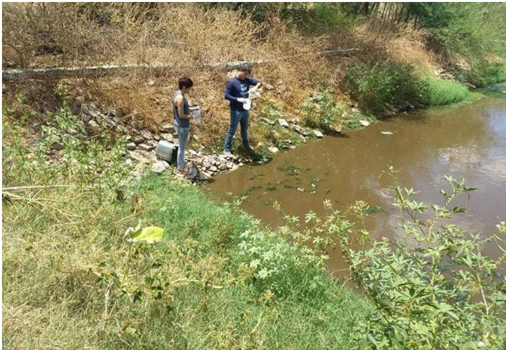
Figura 04. Visitação as ETE para observação do seu funcionamento.