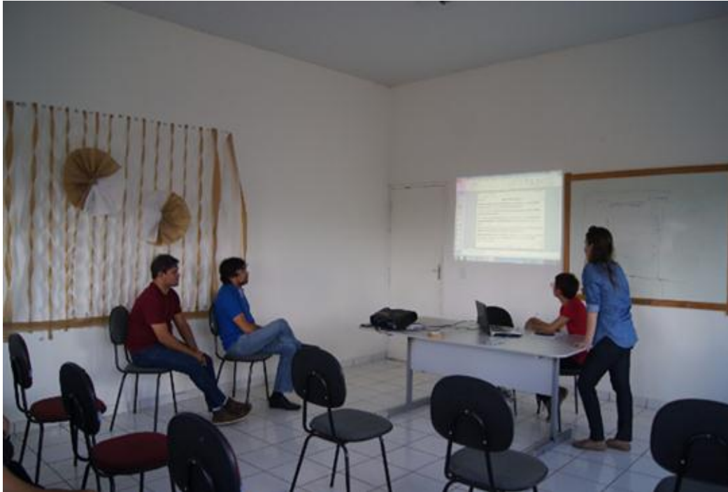
Figura 03. Reunião com os gestores onde realizaram-se entrevistas e debates sobre as possibilidades de reuso da água das ETE no município.