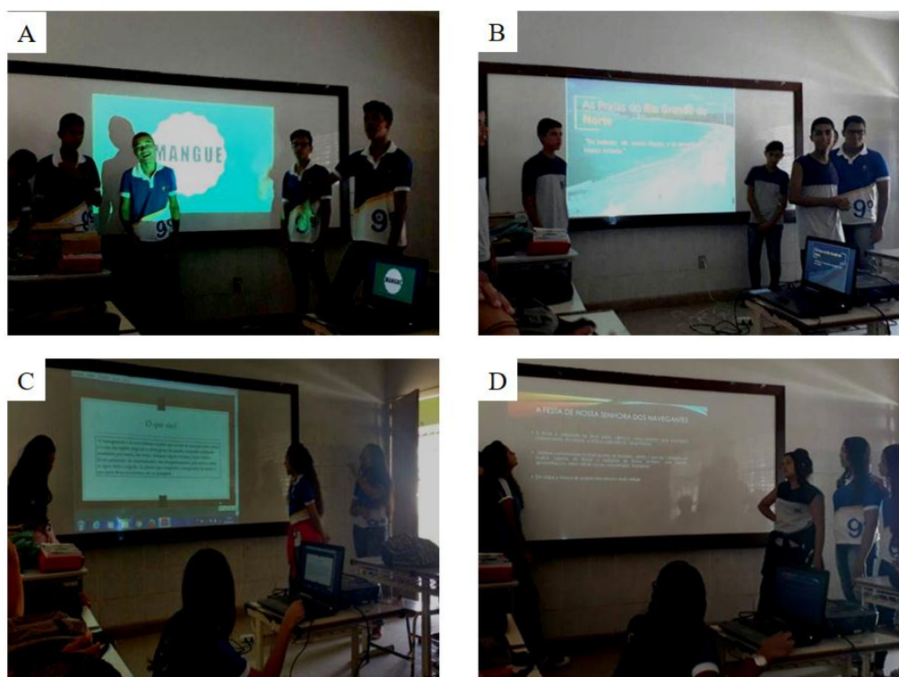
Figura 3: Apresentação dos grupos conforme as temáticas que foram abordadas durante o projeto.

No quarto e último momento deste trabalho, foi idealizado um seminário temático, onde cada grupo de alunos ficou com um tema abordado durante a palestra, oficinas e atividade de campo. Os discentes se reuniram em grupo, na sala de aula para traçarem estratégias de elaboração e organização dos seminários. A proposta consistiu na preparação de uma apresentação em power point , contendo um mapa da cidade de Natal apresentando as feições estudadas, além das características físicas, sociais, econômicas e culturais da região, atreladas às medidas de Geoconservação que poderiam ser aplicadas em cada Geodiversidade, sendo esta capaz de dar suporte para biodiversidade (Figura 5).