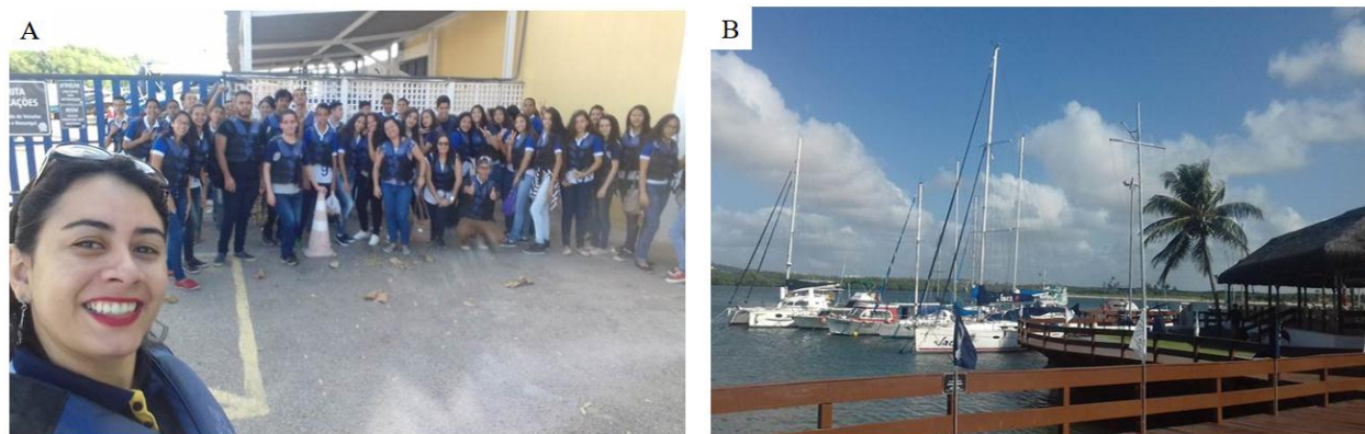
Figura 2: A - Preparação para aula de campo no Barco Escola Chama Maré junto aos alunos da Escola Municipal Professora Terezinha Paulino de Lima. B - Iate Clube de Natal-RN. Fotos: Ana Beatriz C. Maciel (Jun./2017).

A Fortaleza dos Reis Magos foi edificada na zona de praia, construída sob arrecifes adjacentes ao estuário do Potengi, sendo tombada pelo Patrimônio Histórico Nacional, conforme aborda Semurb (2010). A ZPA-8 abrange o ecossistema litorâneo de ampla importância ambiental e socioeconômica. Ressalta-se que é fonte de produção de alimentos, reprodução de espécies da fauna marinha, refúgio natural de peixes e crustáceos, meio propício à indústria pesqueira, atividades portuárias e recreativas, como, também, fonte de sustento para as populações ribeirinhas.