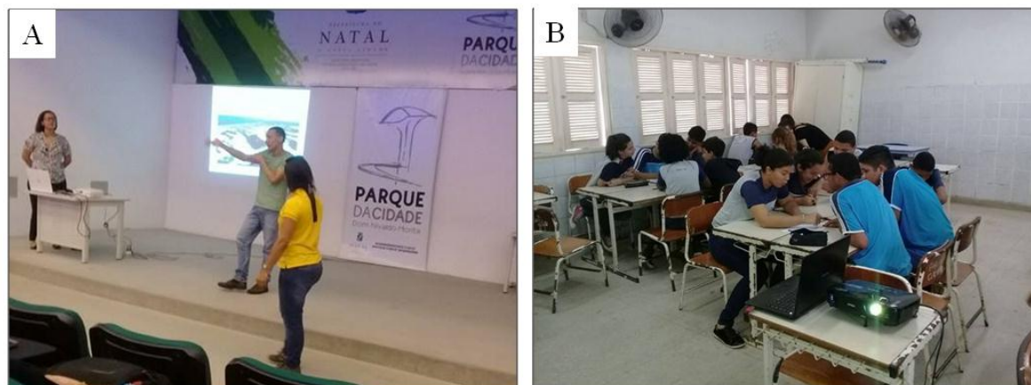
Figura 4: A) Palestra sobre Geodiversidade e Geoconservação proferida pelos alunos do PPGE/UFRN. B) Oficina realizada na Escola Municipal Professora Terezinha Paulino de Lima. (08 Jun./2017).

O terceiro momento deste trabalho consistiu em uma oficina realizada na Escola Municipal Professora Terezinha Paulino de Lima no dia 09 de junho de 2017, onde os alunos já embasados sobre o tema da Geodiversidade e Geoconservação, preencheram uma matriz com auxílio do mapa de Geofácies de Natal, objetivando identificar alguns valores da geodiversidade (educativos, econômicos e culturais) (Figura 4).