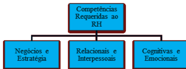
Figura 3 Competências requeridas ao “novo” RH

Para fazer frente aos papéis requeridos a esse “novo” RH, os entrevistados recomendam o desenvolvimento de competências pelos profissionais da área, as quais foram agrupadas em três categorias (ver Figura 3):