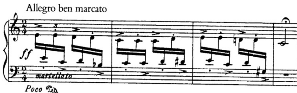
Fig. 1 – Gesto inicial em “Kankikis” das Três Danças Africanas (Villa-Lobos) c.1-4

A partir desta compreensão, podemos entender o uso de tópicas indígenas (PIEDADE, 2013) na obra de Villa-Lobos e, por conseguinte, na obra de tantos compositores brasileiros. Desta forma, Brandão apropria-se deste recurso como origem de periodicidade (AGAWU, 2009). A estrutura da Tocata consiste, basicamente, em quatro unidades distintas determinadas pela recorrência e modificação de elementos apresentados no início do estudo. Ou seja, a elaboração dos ostinati desenvolvidos no decorrer da obra apresentam modificações no início de cada uma das unidades, assim como Villa-Lobos escolhe escrever em diversas obras. O ostinato da abertura da Tocata , por exemplo, é uma referência clara à peça Kankikis das Danças Características Africanas , de Villa-Lobos, importantes obras de piano do início da carreira do compositor (1914/1916).