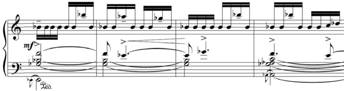
Fig. 14 – Variação do Motivo Ostinato 2 nos compassos 95 a 98

O Ostinato 3 é variado de duas maneiras: através da utilização de seqüências de quartas descendentes, original do Ostinato 3 (Fig. 5), porém sem o segmento cromático (Fig. 15); e através da modificação do ritmo que incide sobre o desenho melódico do ostinato e é agrupado em um tempo em quiálteras de seis semicolcheias (Fig. 16).