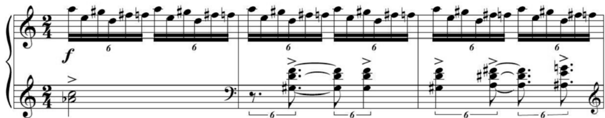
Fig. 16 – Variação do Ostinato 3 nos compassos 177 a 179

Em acréscimo aos ostinati, Brandão apresenta duas melodias, contudo é da primeira, apresentada no início da peça, que deriva o motivo melódico de quatro notas em graus conjuntos descendentes e que compõe as intervenções melódicas no decorrer da obra.