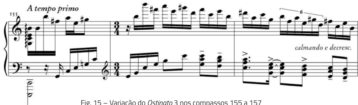
Fig. 15 – Variação do Ostinato 3 nos compassos 155 a 157

O Ostinato 3 é variado de duas maneiras: através da utilização de seqüências de quartas descendentes, original do Ostinato 3 (Fig. 5), porém sem o segmento cromático (Fig. 15); e através da modificação do ritmo que incide sobre o desenho melódico do ostinato e é agrupado em um tempo em quiálteras de seis semicolcheias (Fig. 16).