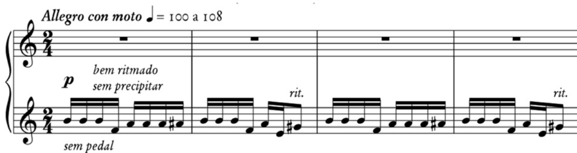
Fig. 2 – Gesto inicial na Tocatta 1 (Vieira Brandão) c.1-4

O discurso é construído a partir da variedade adotada por Brandão para organizar os três ostinati principais (RODRIGUES, 2017), sem subdivisões que possam interromper o fluxo entre as unidades. Pode-se sugerir a existência de uma narrativa sobreposta a partir de tópicas indígenas simultâneas a outros elementos característicos dos processos composicionais de Villa-Lobos.