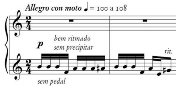
Fig. 3 – Motivos variados no Estudo 4 - Ostinato 1 , gesto da m.e., compassos 1 e 2.

Tocata é uma peça “geralmente livre na forma, concebida basicamente para se ‘tocar’ o teclado, isto é, exibir destreza” (SADIE, 1994, p. 95). A escolha desta forma musical para homenagear Villa-Lobos relaciona-se com a afirmativa de Brandão no que tange à técnica pianística proposta por ele. Os gestos decorrentes dos três ostinati básicos do Estudo n.4 (Toccatina) são apresentados por Rodrigues (2012) como nas figuras a seguir.