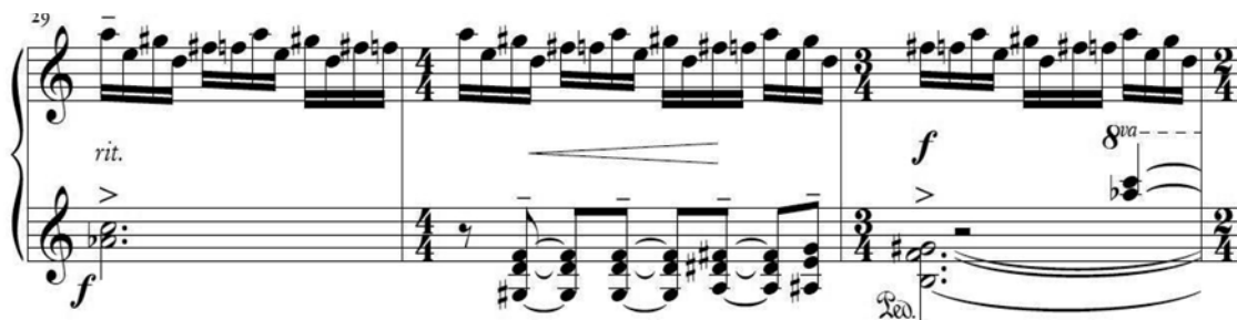
Fig. 18 – Contornos cromáticos no Estudo n.4 , compassos 29-31

Os contornos melódicos, por sua vez, tendem a ocorrer de forma simultânea, isto é, sobrepostos às sonoridades de ostinato, e o modo de canto é evidenciado através da apresentação das melodias de caráter seresteiro. Este tipo de linguagem é próprio dos processos composicionais de Villa-Lobos, principalmente nos anos 1930, como em suas Bachianas Brasileiras , em especial o célebre quarto movimento da Bachianas Brasileiras n.º2, intitulado Tocata (o popular Trenzinho do Caipira ). Outra citação de Villa-Lobos é apropriada na Tocata de Brandão quando o terceiro ostinato (c. 29- 31) é construído sobre um fragmento cromático repetido a cada grupo de seis semicolcheias no gesto da mão direita, enquanto uma sequência também cromática de acordes é sobreposta como gesto para a mão esquerda. A mesma estratégia textural é utilizada por Villa-Lobos em contexto melódico não cromático, por exemplo, em partes da peça Choros n.º5, Alma Brasileira (1925).