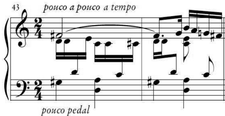
Fig. 6 – Variação do Ostinato 1 nos compassos 43 e 44

Como material principal para a construção da narrativa da tocata, os ostinati são modificados e combinados de maneiras variadas ao longo da peça. A seguir são mostrados compassos iniciais de modificações dos ostinati, ou partes deles. Cabe observar que na Fig. 3 o ostinato é realizado pela mão direita, enquanto nas Fig. 6, 7, 8, 9, 10 e 11 o ostinato passa de uma mão para a outra.