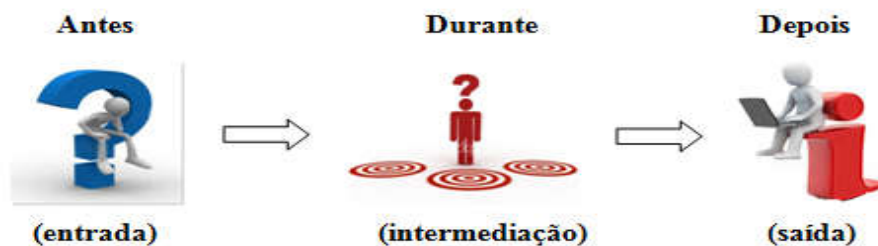
Figura 2 - Esboço do cenário do SIC

A proposta de criação do SIC tem a intenção de dinamizar os serviços oferecidos pela BPE, servindo como um elo da comunicação, um facilitador no desempenho das atividades desenvolvidas pelos funcionários e agentes na transmissão da informação. Seria um centro de intermediação das necessidades, anseios e indagações da clientela que busca informação para resolver seus problemas e contribuir para o fortalecimento da identidade cultural da comunidade.