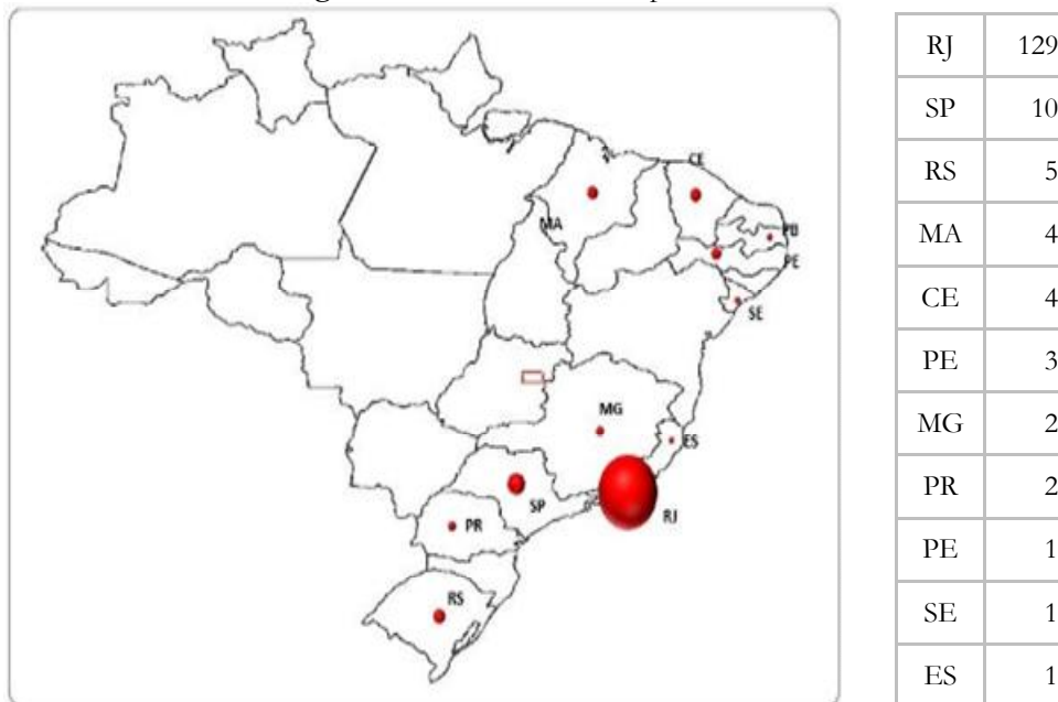
Figura 1 – Alcance do evento por estados brasileiros