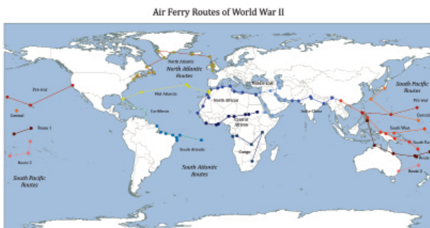
Figura 1: Rotas de transporte aéreo das Forças Armadas norte-americanas na Segunda Guerra Mundial. Destacamos a localização de Belém na South Atlantic Wing.

Traçados esses contornos gerais do contexto da espionagem aliada no Brasil durante a Segunda Guerra Mundial e identificadas as particularidades da ação do FBI, da OSS e da inteligência britânica, deslocaremos agora o foco para os Counter Intelligence Corps (Corpos de Contra-inteligência) do Exército norte-americano, aos quais estavam vinculados os agentes cuja atuação em Belém será examinada nas próximas sessões. Os agentes do CIC, recrutados geralmente entre militares com experiência legal, investigativa e domínio de línguas estrangeiras, desempenharam várias tarefas relevantes na Segunda Guerra Mundial. 19 Uma dessas tarefas, relacionada aos Transportation Corps (Corpos de Transporte), envolvia a avaliação dos riscos à segurança dos portos e aeroportos controlados pelo Exército norte-americano em várias partes do mundo, pelos quais passaram sete milhões de militares e 127 milhões de toneladas de carga, e nos quais trabalhavam 171.000 pessoas.