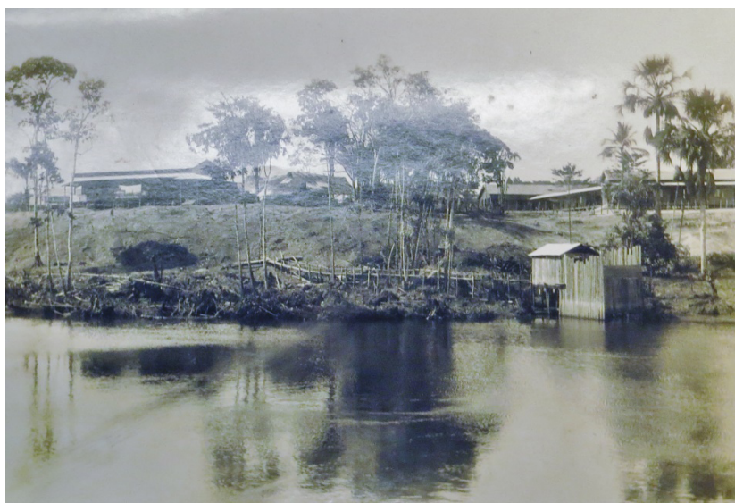
Figura 4: Fotografia de colônia japonesa no Pará, furtada pelos agentes do CIC na sede da Companhia Nipônica em 18 de agosto de 1942