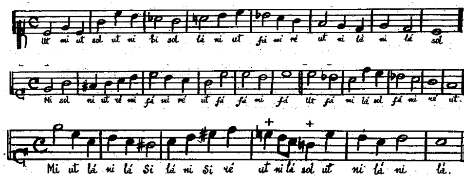
Fig. 1 – Exemplos das Observações 11 (dois primeiros) e 12 (último), (DINIZ, 1977: 44-45).

Uma primeira observação interessante no que diz respeito à didática de Pinto é sua afirmação de que testou o método com alunos sem experiência com música e que estes em menos de doze lições aprenderam a solfejar. Infelizmente não há como saber que tipo de linhas melódicas esses alunos chegaram a cantar sem dificuldade. Nas Observações o autor dá apenas três curtos exemplos de linhas melódicas para explicar o uso das vozes NI, SI e BI.