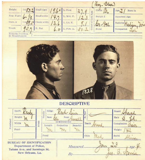
Figura 1. Ficha policial realizada por Alphonse Bertillon, New Orleans Police Department , 1914.

En el contexto actual y dentro de esta estructura de recopilación de datos de los usuarios/as, podemos destacar el sistema DeepFace (Fig.2) como parte del sistema de seguridad y verificación de Facebook capaz de registrar, etiquetar e identificar todas las fotografías de rostros que se filtran y transitan por la plataforma. El software DeepFace se podría considerar como la versión digitalizada del estudio realizado por Alphonse Bertillon en el siglo XVIII. Este policía francés y criminólogo, expuso la antropometría como nueva disciplina y como metodología necesaria para el registro y comparación de todos los datos de los procesados. A través de fichas individuales con fotografías y datos sobre las dimensiones, rasgos y cicatrices logró recopilar una base de datos capaz de identificar a delincuentes y sospechosos.