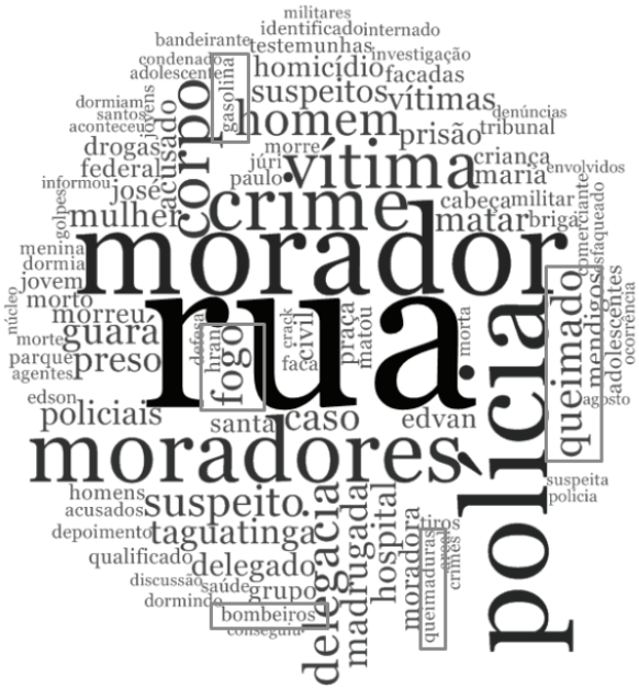
Figura 4. Palavras mais frequentes no tema violência. Figure 4. Most frequent words related to violence.

o fogo utilizado em atos de violência contra pessoas em situação de rua em Brasília; é o fogo com intuito de queimar o corpo humano, um fogo que expressa o desejo de extermínio brutal.