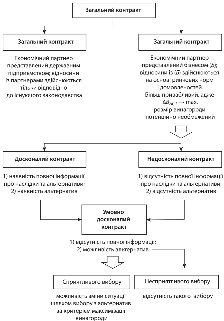
Рис. 3. Типізація контрактів у процесі реалізації БСТ