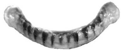
Fig. 4. Mandíbula de P. imperator .