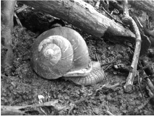
Fig. 1. Polydontes imperator sobre sustrato térreo.