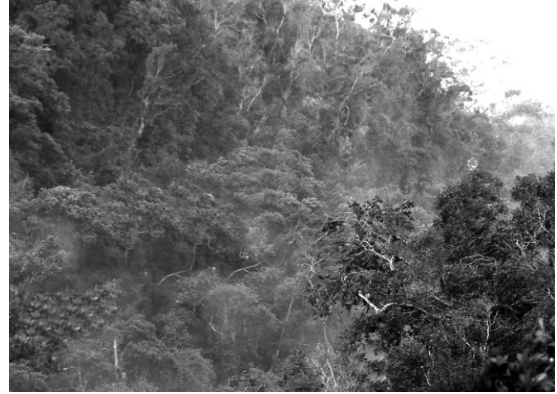
Fig.2. Hábitat de P. imperator en la localidad de Velete.