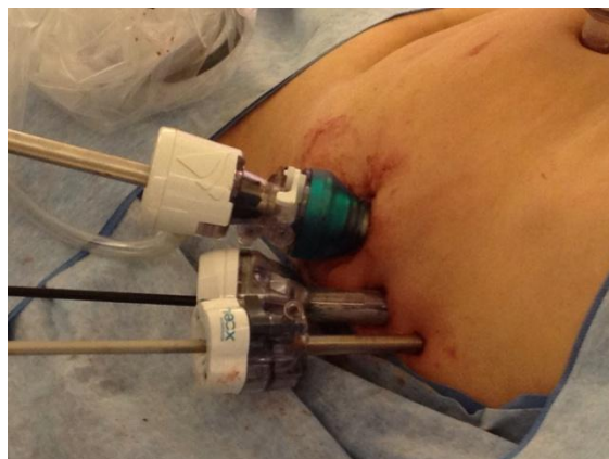
Figura 2. Posición de los trocares para el acceso retroperitoneal

La vía principal de 10 mm supraumbilical a 2 cm a la izquierda. Las vías accesorias de 5 mm en fosa ilíaca izquierda y hipogastrio y vía de 10 mm en fosa ilíaca derecha. En cambio, cuando se realiza el acceso retroperitoneal las vías accesorias se colocan en la línea axilar media (Figura 2).