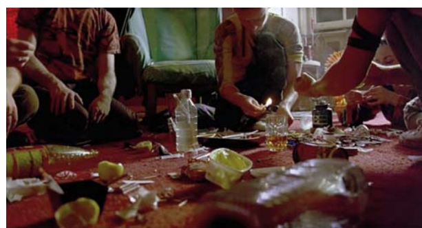
Foto 2. Consumo de heroína en condiciones insalubres.

El abuso de las drogas causa adicción, que se caracteriza por el consumo compulsivo de las mismas. El