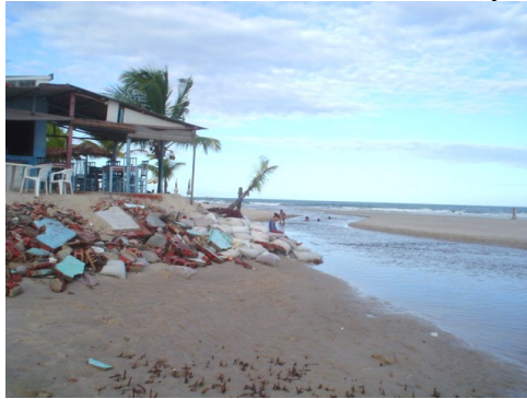
Foto 1: Erosão atingindo barracas de praia próximo à desembocadura rio Guaibinzinho, município de Valença.