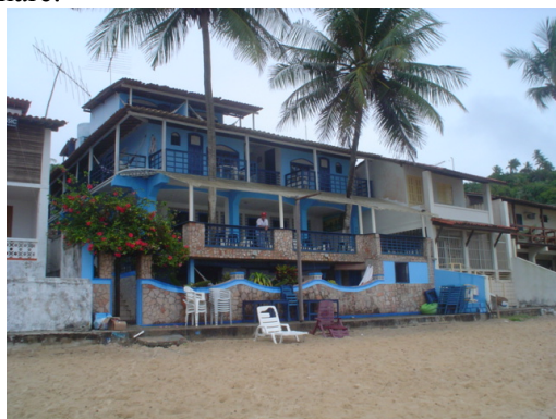
Foto 4: Construções à beira-mar em Morro de São Paulo, Ilha de Tinharé.

Um outro problema ambiental observado nestas praias está associado à ocupação das áreas de mangue. Muitas vezes estas áreas são usadas como depósitos de lixo, gerando risco de contaminação para os ecossistemas costeiros.