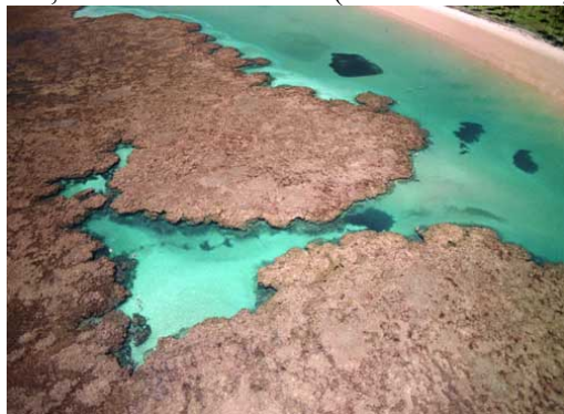
Foto 6: Piscinas naturais geradas pelos recifes de corais em Taipus de Fora, Península de Marajú.

As praias deste segmento apresentam características morfodinâmicas diversificadas nos trechos onde ocorrem recifes de corais ou onde estes estão ausentes. Desta forma, as praias apresentam sedimentos com granulometria variando de areia fina a grossa, as declividades variam de 2 a 10° e as larguras variam predominantemente de 5 a 40 m. A altura das ondas na praia também varia bastante, sendo que nos trechos protegidos pelos recifes em geral não ocorre quebra de ondas na face da praia.