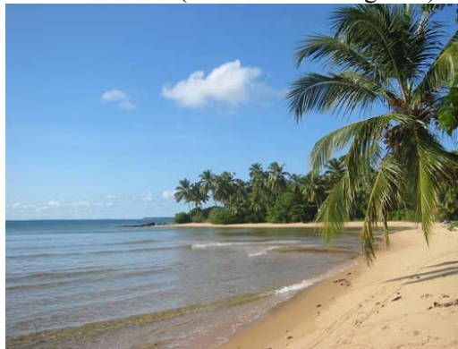
Foto 7: Preservação da paisagem natural na praia de Barra Grande, Península de Marau.

da linha de costa, mas prevalece a preservação das condições naturais. No povoado de Barra Grande, atualmente com grande destaque turístico, não é comum a ocorrência de construções fixas à beira-mar (Foto 7). Neste local, os atuais problemas decorrentes da ocupação e da demanda turística estão associados principalmente à contaminação dos recursos hídricos e, conseqüentemente das praias, com esgoto doméstico. Como não existe um adequado sistema de esgotamento sanitário, são construídas as chamadas “fossas negras”, que constituem uma grave ameaça de contaminação do lençol freático que neste local encontra-se muito próximo à superfície.