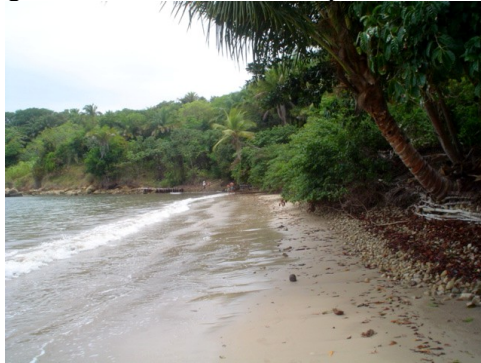
Foto 3: Ausência de praia arenosa e contato direto mar-vegetação em alguns trechos da Ilha de Boipeba.

Também neste segmento a ocupação se dá de forma muito concentrada em algumas praias enquanto que a maior parte da região permanece com pouca ou nenhuma ocupação. Ao longo da Primeira, Segunda, Terceira e parte da Quarta Praia em Morro de São Paulo a urbanização é intensa. Nestas praias são encontradas pousadas, restaurantes, mercados, lojas de material de construção