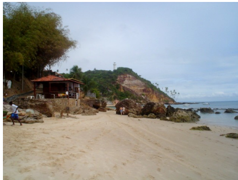
Foto 2: Presença de falésias em Morro de São Paulo, Ilha de Tinharé.

Este segmento corresponde às Ilhas de Tinharé e Boipeba e apresenta características bastante diversificadas. A configuração da linha de costa nestas ilhas é bastante condicionada pela presença das rochas da Bacia de Camamu. Em muitos locais, ao longo deste segmento, estas rochas formam falésias ativas que condicionam o uso e o cenário das praias (Foto 2).