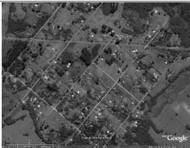
FIGURA 3: Faixa de dutos OSCAN atravessando propriedades do Loteamento Cádiz - Gravataí/RS (modificado de Google Earth , 2008)