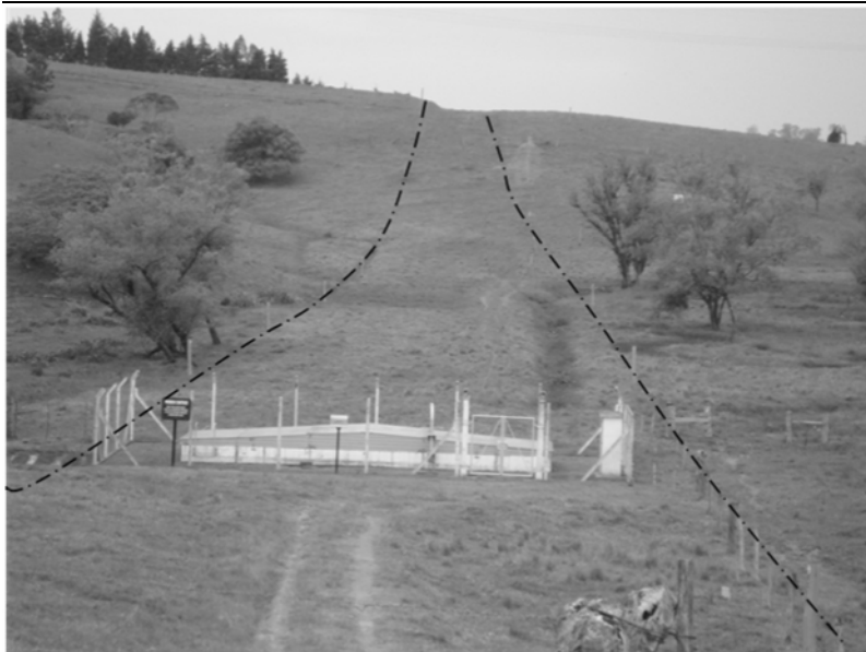
FIGURA 2: Trecho da dutovia OSCAN no município de Gravataí/RS: diferença de cota

O primeiro oleoduto da faixa de dutos Osório-Canoas (OSCAN 16") entrou em operação em 1968, e a implantação da via se deu por meio de imposição do exército (ditadura) e regulamentada por meio de escrituras de servidão de passagem. Um processo indenizatório para os proprietários das terras atingidas pelo empreendimento também foi realizado por parte da Petrobras (SANTOS, A., 2008, informação verbal). As informações sobre a implantação do oleoduto na década de 60 são escassas, visto que a obra é muito antiga e, portanto, não exigia-se estudos prévios à obra como EIA e RIMA na área de implantação. Os registros encontrados sobre a área de estudo em época anterior à implantação da faixa de dutos são fotografias aéreas do ano de 1953 na escala de 1:40.000, as quais serviram de subsídio para a