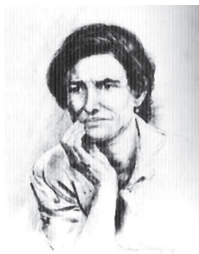
Foto 3: Diana Thorne, Spanish mother: the terror of 1938, 1939 . Lithography. In: Goldberg, The Power of Photography .