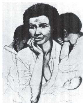
Foto 5: Malik, page of Black Panther's Newspaper , 1973. In: Goldberg, The Power of Photography .

A queixa de Florence Thompson e a ironia de seu reaparecimento na mídia são do mesmo teor dos ataques que a fotografia documental vem recebendo desde a década de 1970. Ela reside nessa relação entre o fotógrafo e o sofredor, que é a relação própria da representação. Podemos dividi-la em três pontos mais ou menos entrelaçados: a exploração, o paternalismo e a manipulação ideológica. Em primeiro lugar, está a idéia do fotógrafo como um predador. A foto não trouxe nenhum tipo de alívio à vítima retratada, apesar de ter feito a fama de sua fotógrafa. Os fotógrafos andariam à caça de sofrimentos alheios e os espectadores consumiriam e louvariam essas imagens com uma espécie de conforto moral. Essa é uma crítica muito comum a pessoas que fazem fotografia documental hoje, como Sebastião Salgado. Salgado tornou-se alvo principal de uma campanha contra as situações demasiado comerciais em que, de forma típica, são vistos seus retratos de pessoas e povos em sofrimento (SONTAG, 2003, p. 67).