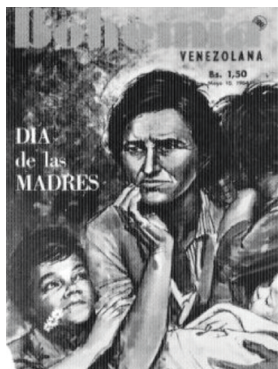
Foto 4: Bohemia Venezolana , 1964. In: Goldberg, The Power of Photography .