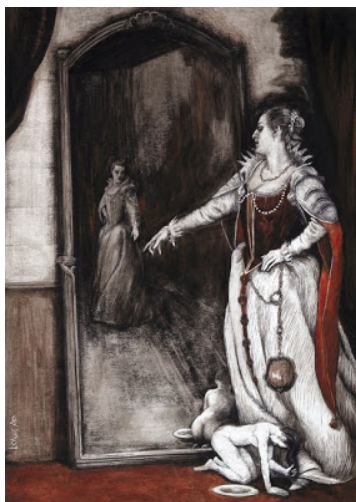
Fig.4. O espelho como símbolo do duplo

Na representação do duplo, bem comum à narrativa gótica, Caruso enfatiza essa discrepância que há entre o lá fora , marcado pela nitidez da condessa, cuja roupa apresenta detalhes em um vermelho intenso; e o lá dentro , uma região turva e inerte em que nada brota.