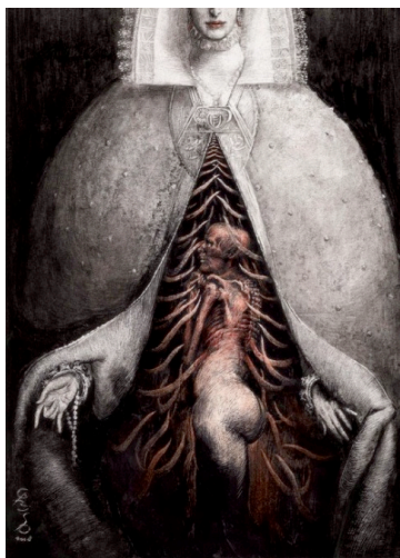
Fig. 1. O abraço da virgem