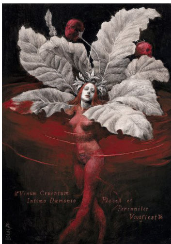
Fig. 5. Os banhos de sangue

Com a cabeça estática como que lembrando a de uma perene e bela escultura (o tom acinzentado da face também confere tal impressão), a condessa de Caruso traz, abaixo de sua cintura submersa, uma bocarra com dentes à mostra, perfil que remete às sereias (sirenes) de tradições greco-romanas e nórdicas tardias, as quais concebem-nas como “criaturas metade mulher, metade peixe”, que viviam em “uma ilha do Mediterrâneo, na costa meridional da Itália” (CIVITA, 1973, p. 167). Após atraírem os navegantes com sua beleza e seu belo canto, elas os arrastavam para o mar e os devoravam.