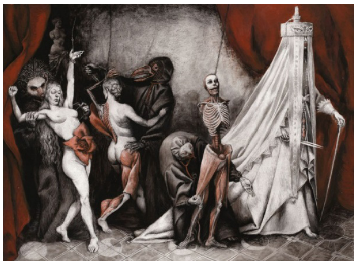
Fig. 3. A dança da Morte

Na interpretação que faz da morte como símbolo, Santiago Caruso novamente assinala expressivamente a distinção entre o branco, o preto e o vermelho, de forma que a maneira como ele organiza os elementos dentro da pintura permita que os detalhes em vermelho sejam acentuados. Fazendo isso, Caruso outra vez confere ao vermelho um peso visual diferenciado. Ao criar cortinas de um vermelho vívido que se abrem para um fundo branco, o artista emoldura a cena em que uma mulher (provavelmente uma costureira) dança com a Morte. À medida que o tempo transcorre, observamos a morte despi-la de sua carne e de seus músculos e cumprir o seu trabalho ao fim da dança.