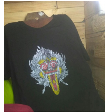
Gambar 2. Seni Lukis T-Shirt bertema Rangda (Sumber: I Nyoman Ngurah Ardika Yasa, 2018)

Pada penelitian ini, teknik pengumpulan data dilakukan dengan melakukan pengamatan langsung terhadap ilustrasi rangda karya I Nyoman Ngurah Ardika Yasa pada t-shirt lukis, melakukan kajian pustaka dan wawancara secara langsung dengan I Nyoman Ngurah Ardika Yasa. Lokasi penelitian dilakukan di Desa Abian Semal Badung tepatnya di Jalan Arja No. 11, Banjar Belawan. Dipilihnya I Nyoman Ngurah Ardika Yasa sebagai objek penelitian didasari oleh karya-karya yang dibuatnya memilih tema budaya khususnya budaya Bali.