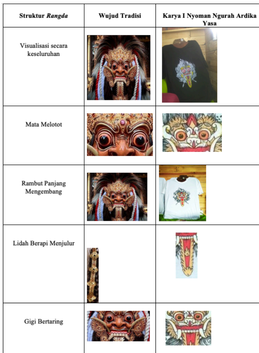
Tabel 1. Perubahan Wujud Pada Ilustrasi Rangda

an, impian dan horor. Kebanyakan cerita-cerita yang ada, pada umumnya raksasa digambarkan dengan bentuk yang menyimpang dari makhluk hidup normal lainnya. Hal ini memberi keleluasan dalam mengembangkan imajinasi yang lebih bebas untuk menciptakan bentuk - bentuk imajinatif. Pengalaman hidup sebagai orang Bali yang tidak bisa lepas dari aneka ragam bentuk kesenian dan kebiasaan orang Bali yang mempercayai dua sisi dunia ( skala dan niskala ) serta pengalamannya yang gemar pada karakter dan cerita daerah Bali, memberikan ruang bagi I Nyoman Ngurah Ardika Yasa untuk berimajinasi seluas-luasnya terhadap peristiwa maupun wujud diluar nalar manusia. Menurutnya, kebiasaan dari kecil berimajinasi terhadap unsur-unsur budaya Bali yang beragam seperti warna, bentuk, spirit, cerita dan nuansa mistis telah memberikan inspirasi tersendiri bagi karya-karyanya. Masyarakat Bali memiliki kepercayaan tentang dunia lain termasuk dunia mistis dan hidup berdampingan dengannya menyebabkan