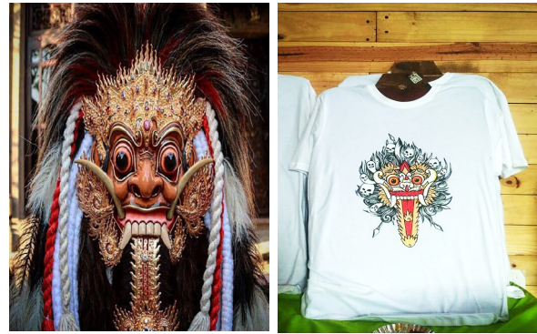
Gambar 5. Perbandingan bentuk rangda tradisional dan karya I Nyoman Ngurah Ardika Yasa.

Ilustrasi rangda karya I Nyoman Ngurah Ardika Yasa diciptakan tidak dengan mengedepankan nilai keindahan secara konvensional, namun berdasarkan imajinasi atas rasa dan pengalaman estetis yang diterimanya pada masa yang lalu. Pada karyanya, I Nyoman Ngurah Ardika Yasa menggambarkan wujud rangda dengan pengayaan bentuk melalui penyederhanaan, sehingga karakter rangda terlihat berbeda dengan wujud rangda secara tradisi. I Nyoman Ngurah Ardika Yasa (wawancara pada 17 Februari 2018) mengatakan bahwa perubahan bentuk sengaja dilakukan untuk menjawab kebosannya atas keseragaman, mencoba membantah kaidah - kaidah bentuk tradisi dan ingin menciptakan sebuah perbedaan. Melalui karyanya, I Nyoman Ngurah Ardika Yasa menginginkan timbulnya beragam interpretasi positif dari penikmat. Hal tersebut menandakan bahwa ilustrasi rangda karya I Nyoman Ngurah Ardika Yasa lahir dari paradigma berpikir postmodern. Seperti yang tampak pada ilustrasi rangda pada gambar