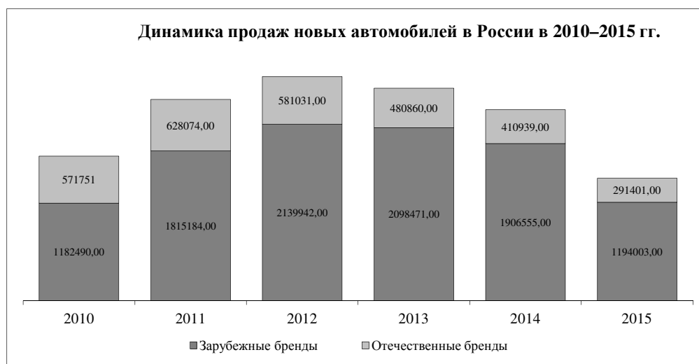
Рис. 1. Продажи новых автомобилей в России за 2010–2015 гг., шт. [6]

зарубежных брендов, 291,401 тыс. шт. отечественных брендов. Падение рынка показало минус 36 % по сравнению с 2014 г., но оно оказалось не столь глубоким, как в 2009 г. – на 50 %. Во-первых, отрасль была уже готова к таким потрясениям, пережив 2009 г. Во-вторых, в 2015 г. оказывалась мощная государственная поддержка автомобильного рынка – было выделено 43,3 млрд руб. Средства были направлены на несколько программ: на поддержку утилизации и трейд-ин (22,5 млрд руб.), льготного автокредитования (5 млрд руб.) и льготного авто лизинга (1,5 млрд руб.), а также субсидирования закупок регионами газомоторной техники (3 млрд руб.) и машин для органов власти (11,3 млрд руб.) [4].