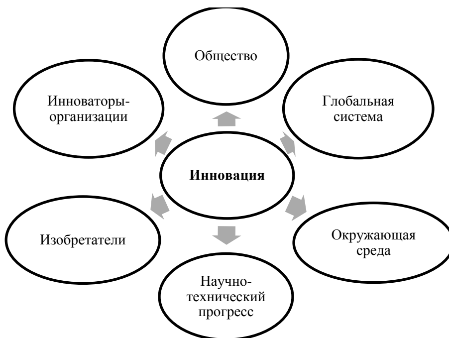
Рис. 2. Среда инновации [6]

рынок, обладающее определенными свойствами и востребованностью на рынке. Из чего состоит разработка инновационной стратегии компании? Во-первых, это выбор самой инновационной технологии и определение с финансированием всей инновационной деятельности. Вопрос диагностики вариантов выбираемой стратегии, расчет ее эффективности и разработка системы внедрения на практике, а также дальнейшая система управления, контроля и сопровождения выбранного направления является задачей команды менеджеров предприятия. Инновации существуют и формируются в определенной среде, схема которой представлена на рисунке 2.