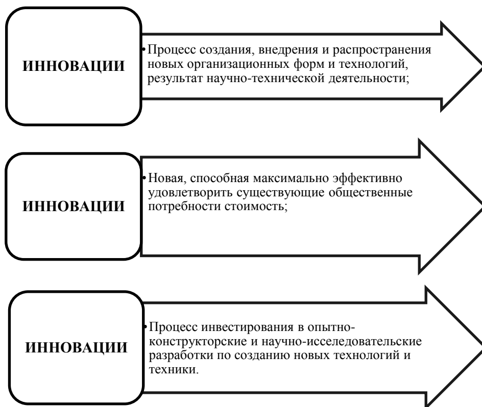
Рис. 1. Определение инновации как процесса

Инновация трактуется также в качестве результата научного труда, который направлен на совершенствование в целом общественной практики и предназначен для реализации в общественном производстве. Понятия «инновация» и «нововведение» считаются при этом синонимами [3]. В данной статье инновацию принято трактовать конечным результатом инновационной деятельности, которая на рынке реализуется в виде нового или измененного (усовершенствованного) продукта или технологического процесса, применяемой на практике.