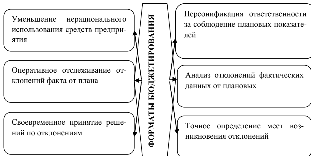
Рис. 3. Направления действия дескриптивного освоения принципов бюджетирования

Внедрение системы бюджетирования в полноценном ритме позволит решить многие задачи в управлении предприятием. На рисунке 3 продемонстрирован лишь узкий спектр тех направлений, которые могут быть усовершенствованы с применением системы бюджетирования. Необходимо отметить: в силу того, что существует множество ограничивающих факторов в повышении эффективности деятельности отраслевых комплексов в целом и предприятий в частности, идея концепции бюджетирования получает все более диверсифицированные формы; порядок формирования бюджетов изменяется под влиянием информационной энтропии.