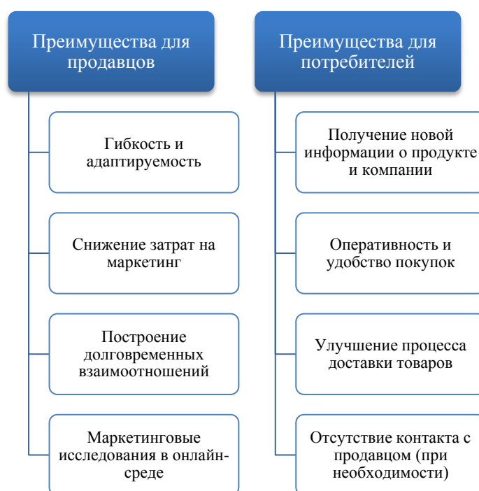
Рис. 2. Преимущества для продавцов и потребителей

Проведенный анализ интерактивных коммуникаций позволил нам выделить новые возможности и преимущества с точки зрения продавцов и потребителей (см. рис. 2).