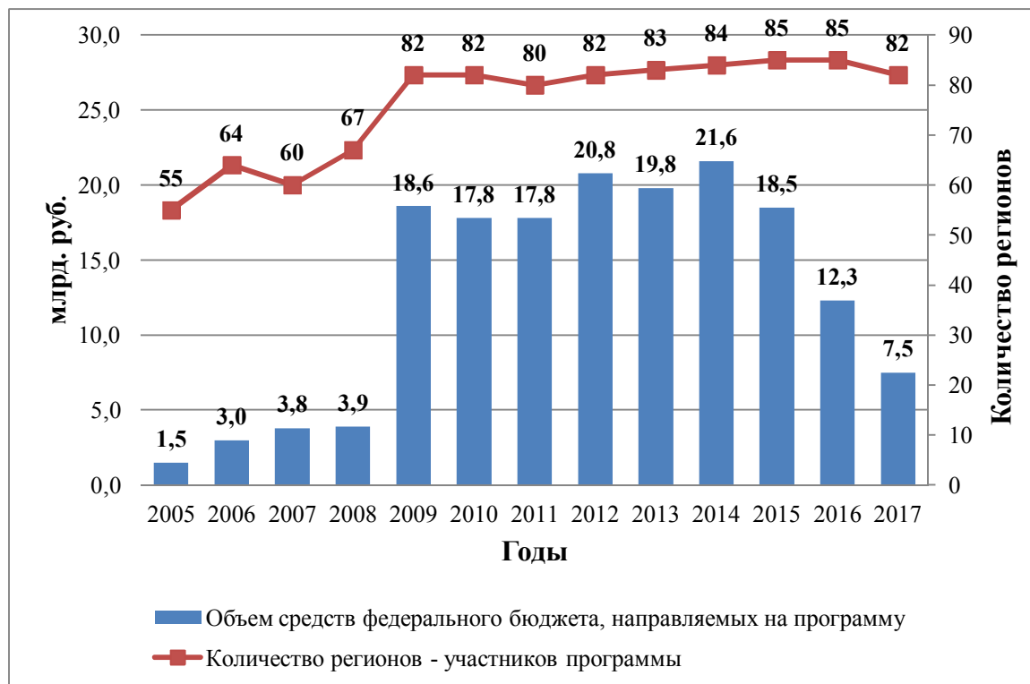
Рис. 3. Финансирование федеральной финансовой программы поддержки малого и среднего предпринимательства России за 2005-2017 гг. [6]

2770562 единиц. Конечно, не все зарегистрированные предприятия малого и среднего бизнеса участвуют в данной программе и получают субсидии, однако анализ показывает, что имеющаяся государственная поддержка пока что малоэффективна.