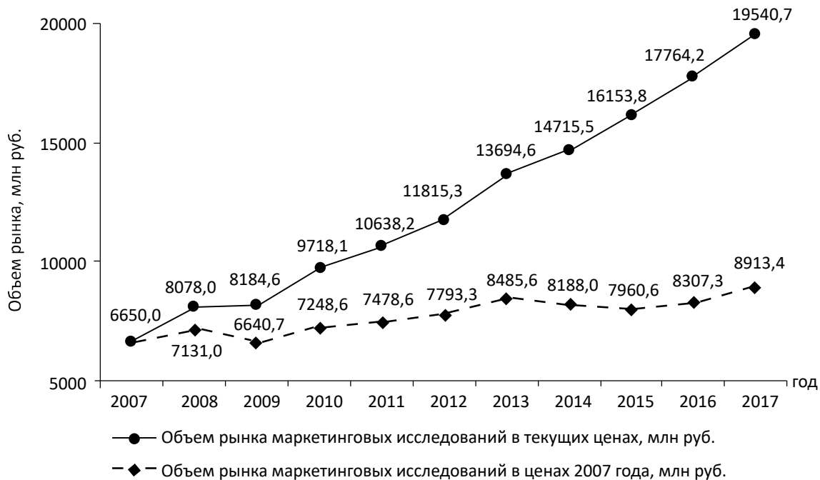
Рис. 1. Динамика объема рынка маркетинговых исследований за период 2007-2017 гг. в России