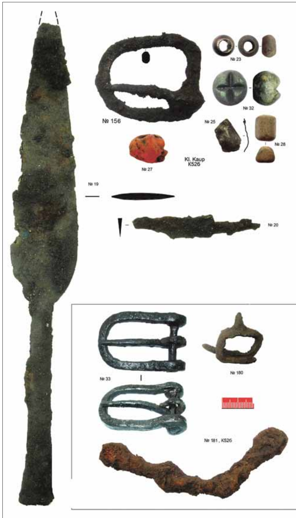
5 pav. Kapo K52b inventorių (Кулаков, 2011)