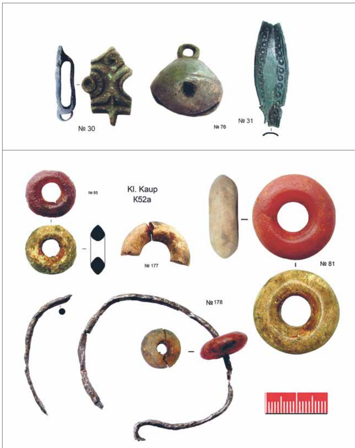
2 pav. Kapo K52a įkapės (Кулаков, 2011). Gintariniai karoliai – pirminės būklės ir juos konservavus