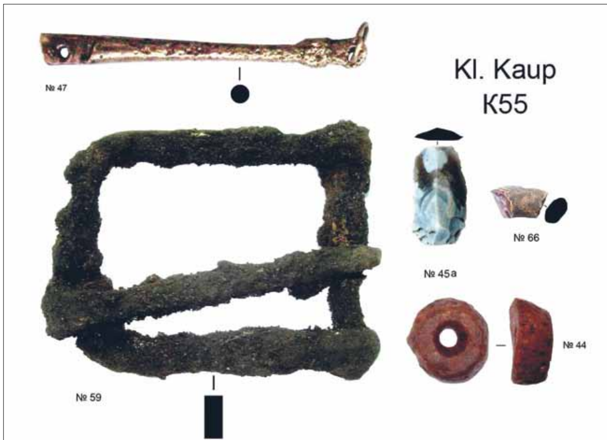
6 pav. Kapo K55 inventorių (Кулаков, 2011)