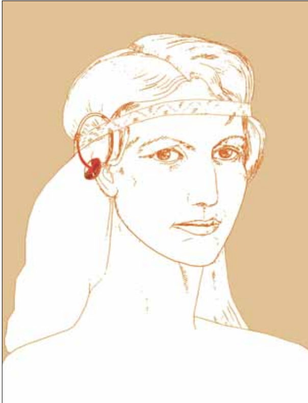
3 pav. Antsmilkinių su gintaro karoliais rekonstrukcija pagal kapą K52a

Fig. 3. Temple ornaments with amber beads. Reconstruction based on grave K52a