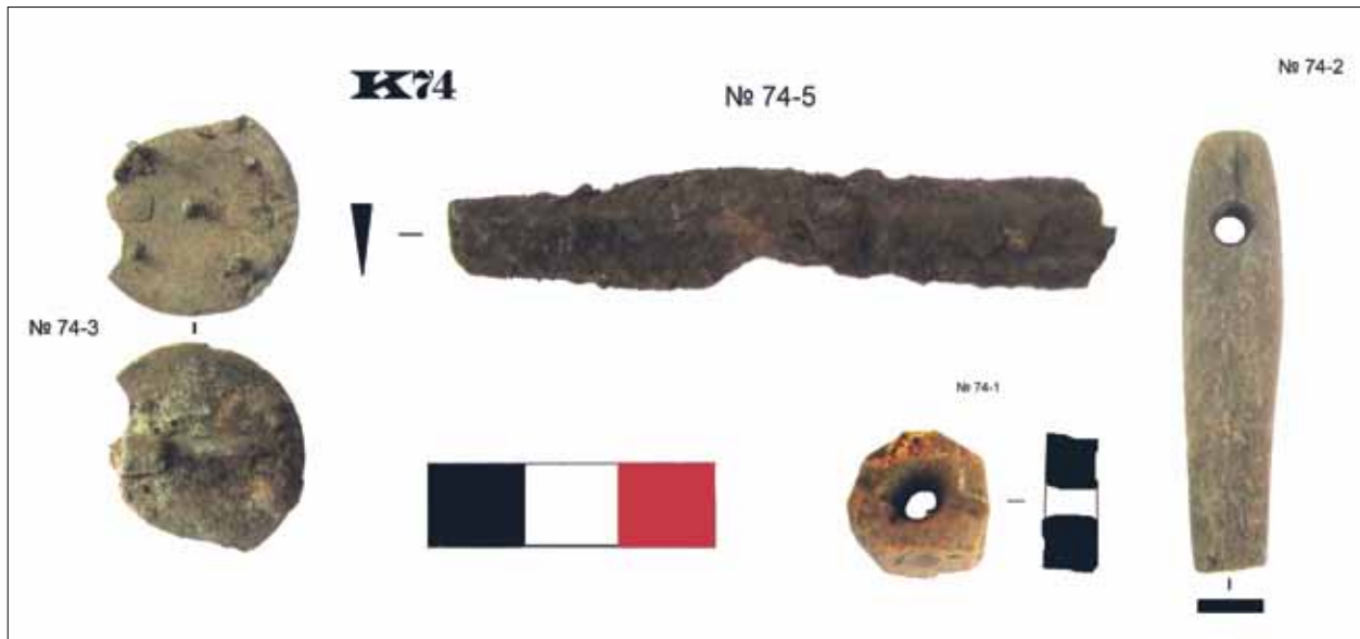
7 pav. Kapo K74 inventorių (Кулаков, 2013)