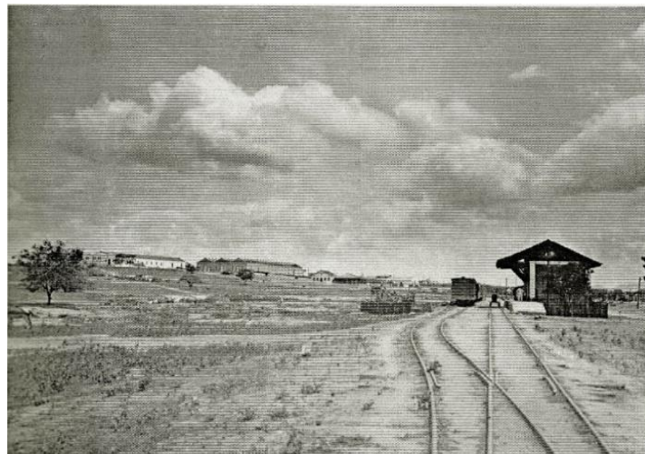
Figura 2: Estação da Pedra, da Estrada de Ferro Paulo Afonso, em segundo plano, a Fábrica de Linhas, em 1916.

Com mudanças estruturais no meio de transporte nacional, o papel das ferrovias que vinha sendo relegado desde meados dos anos 1950 foi, notadamente no Governo Militar, a partir de 1964, que a supressão da ferrovia se deu com mais vigor, através da criação do programa de erradicação dos ramais ferroviários considerados antieconômicos. Entre os inúmeros quilômetros de ferrovias desativados, deixaram de operar ainda no primeiro ano da ditadura civil-militar, os 116 km da EFPA. Desde então, a estrutura rodoviária nacional se consolidou, sendo o principal meio de transporte até hoje (PAULA, 2001; SILVA, 2012).