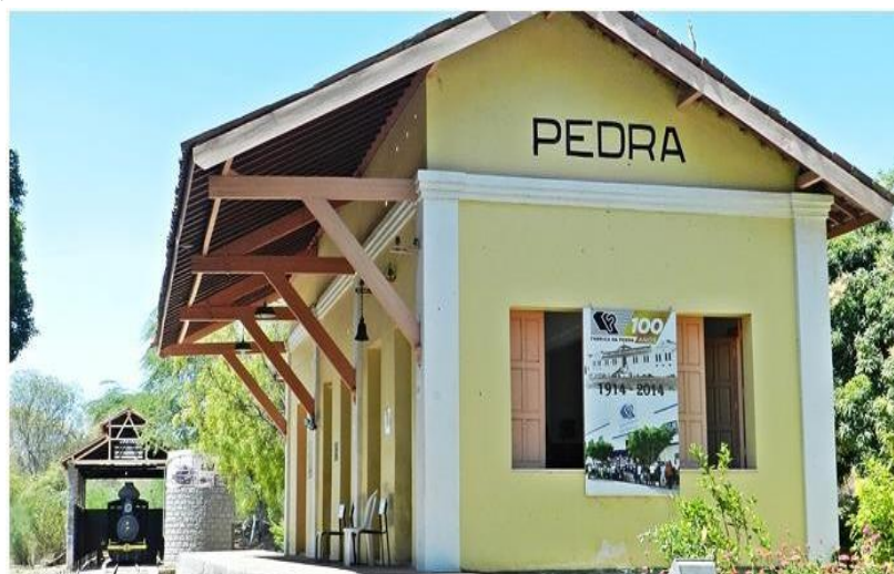
Figura 3: Prédio da antiga Estação da Pedra onde abriga atualmente o Museu Delmiro Gouveia.