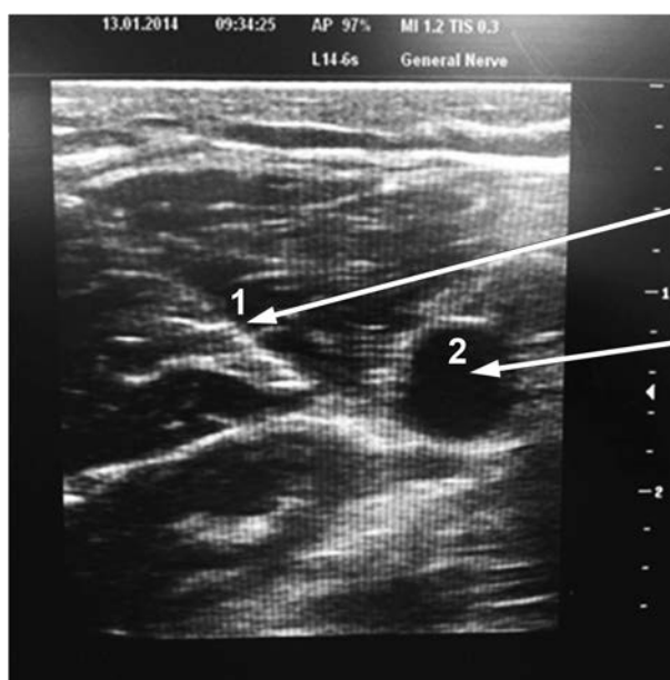
Рис. 2. Ультразвуковое окно: визуализация иглы (1) и a. axillaris (2) на экране сканера.