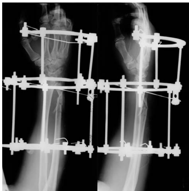
Рис. 5. Рентгенограммы больного П. после операции.

Через 4,5 месяца по данным рентгенограмм и проведенной клинической пробе перелом сросся, пациент госпитализирован для демонтажа аппарата внешней фиксации (рис. 6).