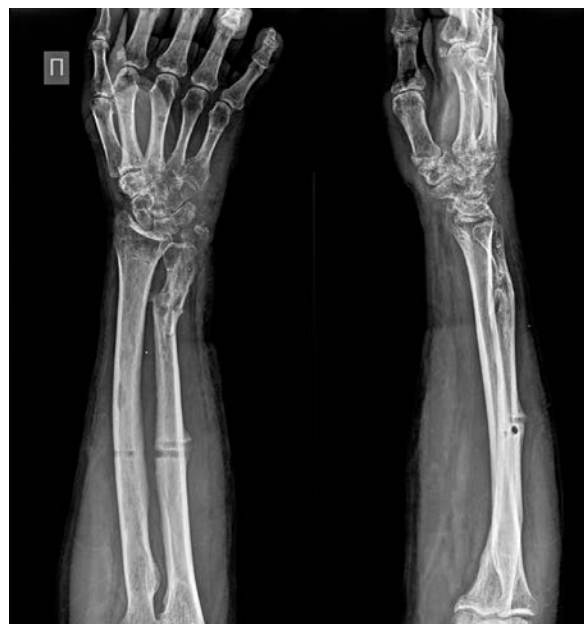
Рис. 7. Рентгенограммы и предплечья больного П. после демонтажа аппарата.