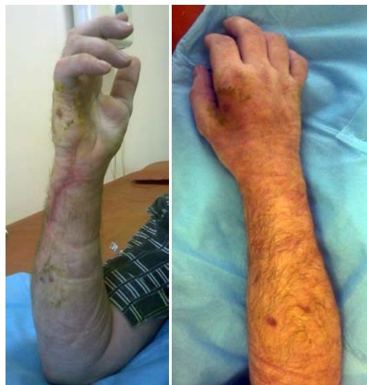
Рис. 8. Фото правой верхней конечности больного П. после лечения.