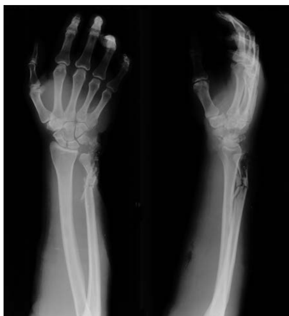
Рис. 2. Рентгенограммы больного П. до операции.

произведена обработка локтевой кости, костей запястья в пределах здоровой кости – патологическое содержимое удалено. Рана отмыта растворами антисептиков, далее произведена ультразвуковая обработка раны (аппарат SONOCA-185) раствором водного хлоргексидина (рис. 3).