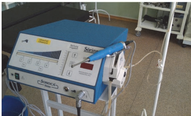
Рис. 3. Аппарат SONOCA-185 для ультразвуковой обработки раны.

произведена обработка локтевой кости, костей запястья в пределах здоровой кости – патологическое содержимое удалено. Рана отмыта растворами антисептиков, далее произведена ультразвуковая обработка раны (аппарат SONOCA-185) раствором водного хлоргексидина (рис. 3).