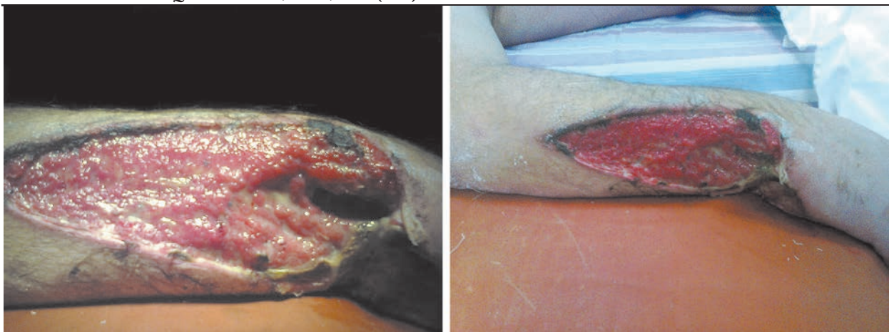
Рис. 1. Фотография правой верхней конечности больного П. до операции в ИНЦХТ.