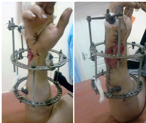
Рис. 4. Фотографии больного П. после операции.

В послеоперационном периоде осложнений не было. Проведен курс антибактериальной, антикоагулянтной, противовоспалительной, сосудистой, реологической терапии, курс лазеротерапии на область правого предплечья и кисти. Проводилось лечение, предписанное неврологом – курс иглорефлексотерапии № 10, курс электростимуляции локтевого нерва № 10. Выполнялись перевязки с раствором бетадина. Послеоперационная рана зажила первичным натяжением, швы сняты на 20-е сутки. Дренаж удален на 3-и сутки. Пациент выписан на амбулаторное долечивание с рекомендациями.