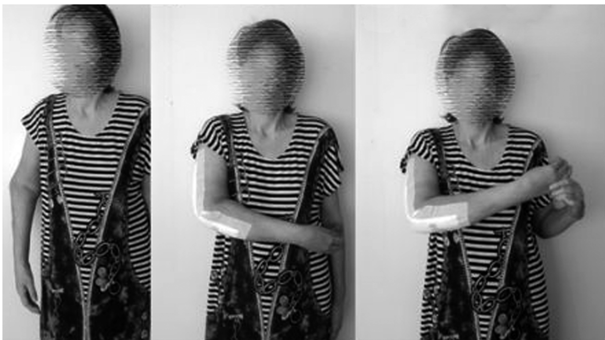
Рис. 3. Пациентка Л. на 7-е сутки после операции.