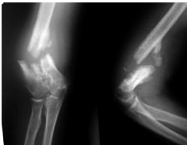
Рис. 4. Пациент Л., 43 года. Рентгенограммы до операции.