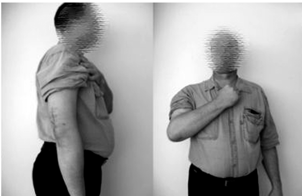
Рис. 6. Пациент Л. через 30 суток после операции.