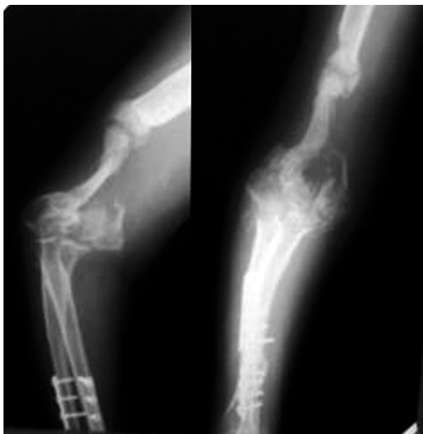
Рис. 1. Пациентка Л., 47 лет. Рентгенограммы до операции.