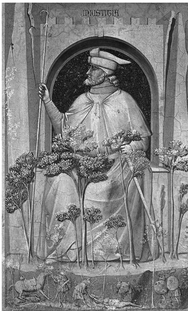
Abb. 1: Giotto's Iniusticia in der Arena-Kapelle in Padua (1304-06)