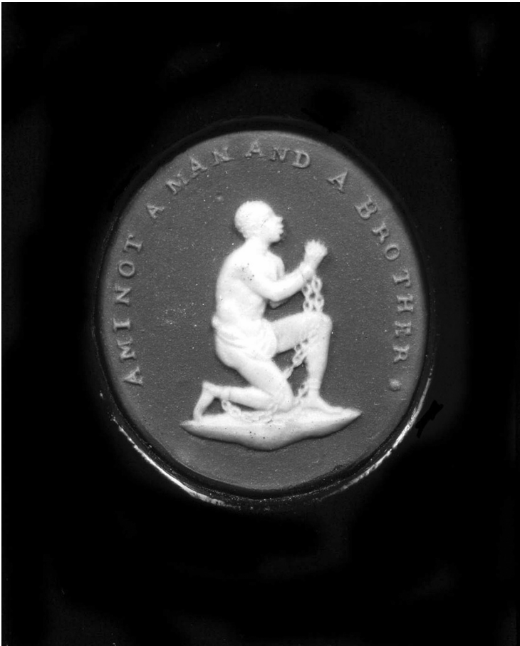
Abb. 3: Anti-Slavery Medallion – seit 1787 von dem Porzellanfabrikanten Josiah Wedgwood verbreitet.