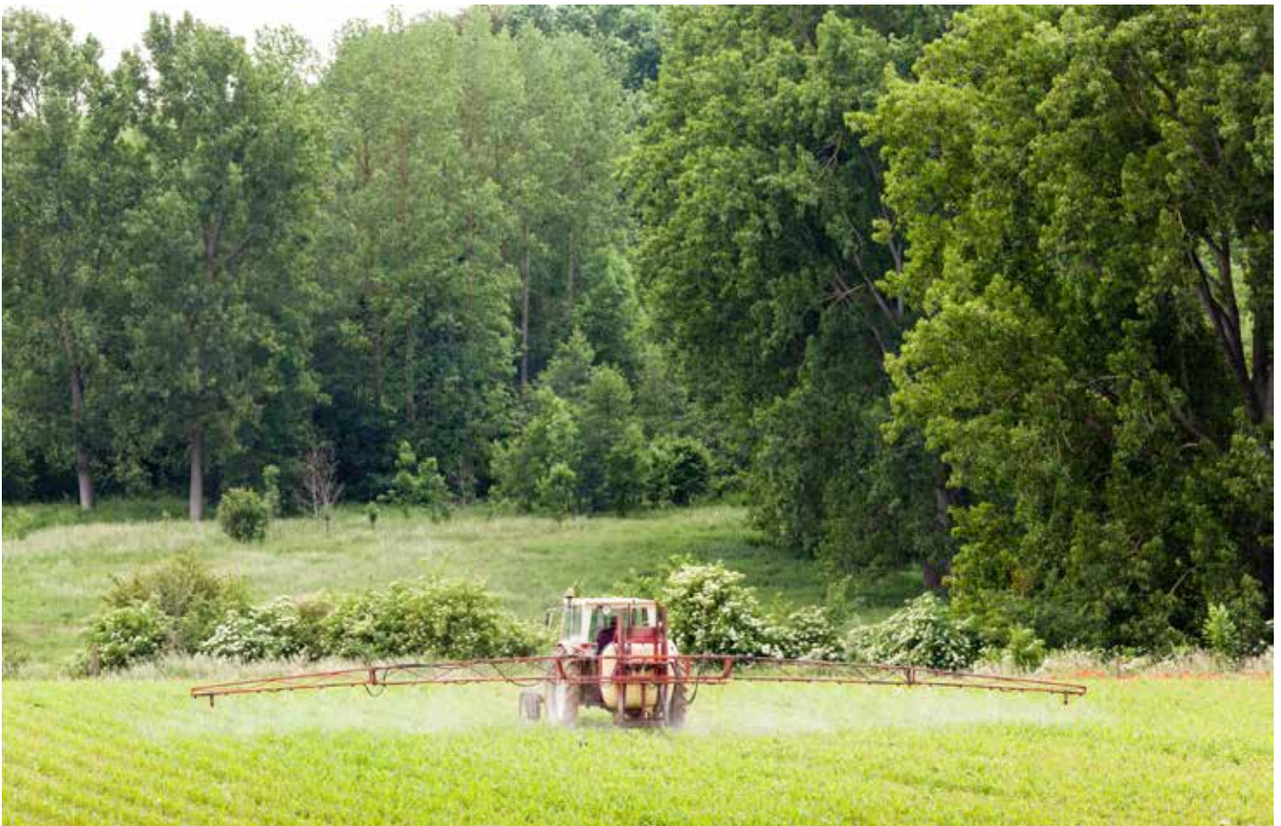
» Figuur 1. Het grootschalig en overmatig gebruik van bepaalde pesticiden vormt mogelijk een van de grootste problemen voor onze akkervogels. Figure 1. The large-scale and excessive use of certain pesticides may be one of the biggest problems for our farmland birds.

De stand van de boerenlandvogels is de laatste decennia in razend tempo afgenomen. De belangrijkste reden hiervoor is de toenemende intensivering van het agrarisch gebruik. Die intensivering gaat gepaard met onder meer het veelvuldig gebruik van bestrijdingsmiddelen (pesticiden). Een artikel dat we publiceerden in het wetenschappelijk tijdschrift Nature plaatst de zogenaamde neonicotinoïden in het verdachtenbankje (Hallmann et al. 2014). In dit verhaal willen we deze studie in het perspectief plaatsen van onze kennis over de manier waarop deze middelen tot achteruitgang kunnen leiden en welke kennis nog ontbreekt om de bewijsvoering rond te krijgen.