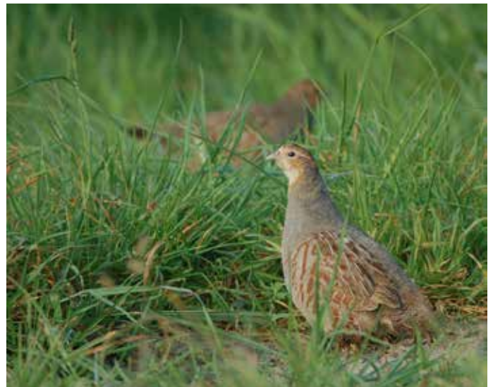
Figuur 4. De Patrijs Perdix perdix is een van de directe slachtoffers van het gebruik van pesticiden.

Welke harde aanwijzingen zijn er in de literatuur te vinden dat deze indirecte effecten van pesticiden, via een achteruitgang van ongewervelden, de vogelstand negatief beïnvloeden? Het leggen van causale verbanden tussen het gebruik van pesticiden, een eventuele