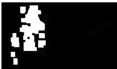
Fig. 11 Imagen resultado de 2 dilataciones, 6 erosiones y 4 dilataciones.