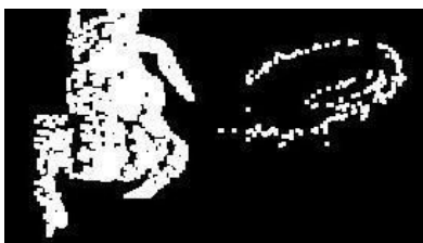
Fig. 8 Una dilatación inicial