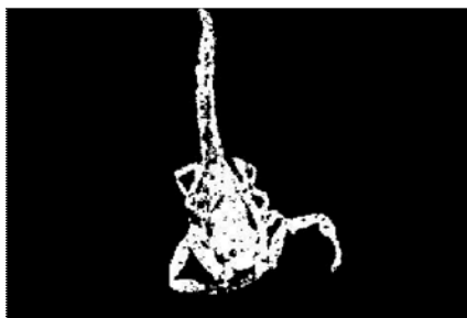
Fig. 5 Imagen de escorpión solo con color de fluorescencia.