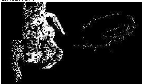
Fig. 6 Imagen de un escorpión (izquierda) y de un bicho bolita (derecha).

Una vez finalizado el algoritmo se procedió a realizar ensayos en presencia de otros especímenes que puedan estar normalmente en el mismo ambiente que un escorpión. El primer ensayo de este tipo se realizó con un bicho bolita ( Porcellio laevis ), dicho ensayo demostró un inconveniente que se ilustra a continuación en la Fig. 6 con una imagen del color buscado como el caso anterior.