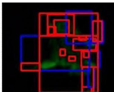
Fig. 3 Imagen con escorpión de fondo.

Encerrar los píxeles en un rectángulo permite tener los límites del mismo y poder analizar en ese rectángulo solo la presencia del color deseado. Si dentro del rectángulo de movimiento hay píxeles del color buscado se da la detección y se marca este rectángulo de color rojo. Este último puede superponer un rectángulo azul preexistente en caso de tener un píxel del color buscado dentro del movimiento, aparentando una detección sin previa detección de movimiento, pese a que esta se haya dado. La Fig. 3 muestra una imagen de ejemplo con un escorpión de fondo, donde se pueden apreciar los diferentes rectángulos de colores azul y rojo, además de un ejemplo de un rectángulo rojo no contenido dentro de otro azul. La Fig. 4 ilustra el diagrama de flujo del funcionamiento del programa para la detección de escorpiones.