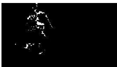
Fig. 7 Una erosión simple