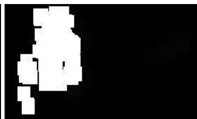
Fig. 12 Imagen resultado de 2 dilataciones, 6 erosiones y 8 dilataciones.

Aunque la Fig. 11 tiene un buen resultado su tamaño y densidad pueden mejorar, obteniéndose así la Fig 12. Esta se obtuvo luego de realizar 2 dilataciones, 6 erosiones y 8 dilataciones, muestra el resultado aceptable que se buscaba, en la cual no se observa al bicho bolita, y el tamaño y densidad del escorpión se pueden apreciar de manera adecuada, por lo que utilizaremos este método para procesar nuestra imagen del color deseado antes de encontrar los contornos y áreas para realizar la detección pertinente. Las funciones de OpenCV utilizadas para estos procesos son cvErode() y cvDilate() .