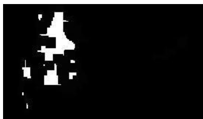
Fig. 10 Imagen resultado de 2 dilataciones y 6 erosiones.

Para solucionar la imagen anterior se realizaron dos erosiones más obteniendo el resultado deseado de eliminar al bicho bolita. Para compensar la degradación del escorpión se procederá a realizar dilataciones que le devuelvan algo de su forma y tamaño original.