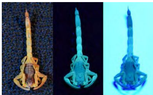
Fig. 1 Escorpión Tityus trivittatus con luz natural y UV con diferentes fondos.

Los elementos utilizados para los ensayos son una computadora, una Webcam, una fuente de luz UV y un espacio oscuro donde poder visualizar la fluorescencia de los escorpiones. Dicho espacio va desde una caja cerrada para los primeros ensayos hasta una habitación oscura.