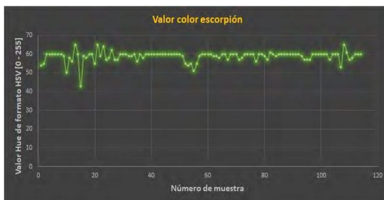
Fig. 2 Gráfico de valores obtenidos del color del escorpión.

Para saber cual es el color que se busca se tuvo que crear un programa que tome una captura de la Webcam y muestre el color del píxel que se selecciona con el mouse. Utilizando este software se procedió a realizar un muestreo de múltiples puntos del escorpión, a fin de obtener suficientes muestras para obtener un intervalo de valores para el color a detectar. En Fig. 2 se presenta el registro de las muestras obtenidas del color del escorpión.