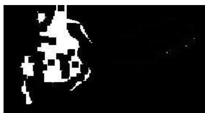
Fig. 9 Imagen resultado de 2 dilataciones y 4 erosiones.

Para solucionar la imagen anterior se realizaron dos erosiones más obteniendo el resultado deseado de eliminar al bicho bolita. Para compensar la degradación del escorpión se procederá a realizar dilataciones que le devuelvan algo de su forma y tamaño original.