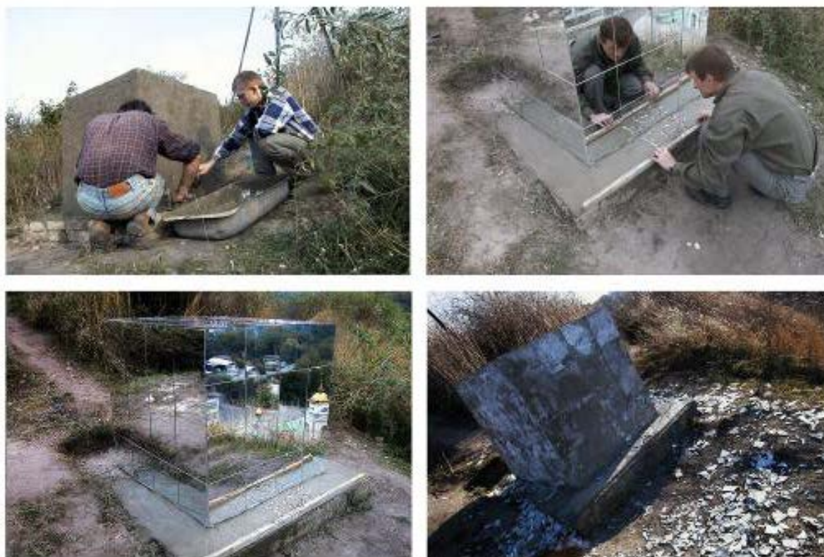
Рисунок 1. «Станция-1», кирпич, зеркальные плитки, 108x108x108 см, гора Замковая, г. Киев