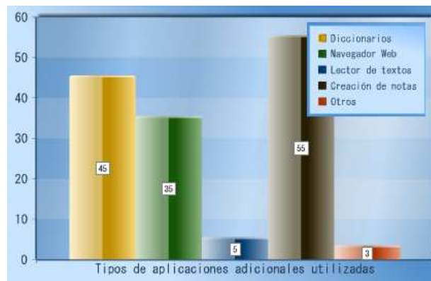
Tipos de aplicaciones utilizadas Vs. Total de Usuarios

Esta primera información hace referencia al uso del dispositivo, el cual manejaba respuestas cerradas de selección múltiple en las encuestas. Las siguientes preguntas fueron de tipo abierto que buscaban saber qué áreas del conocimiento involucraron los estudiantes, en qué les ayudó el servicio, cuáles comentarios tienen acerca de los E-readers y qué sugerencias le pueden aportar a la DBUV para seguir mejorando. Las respuestas más comunes se resumen a continuación: