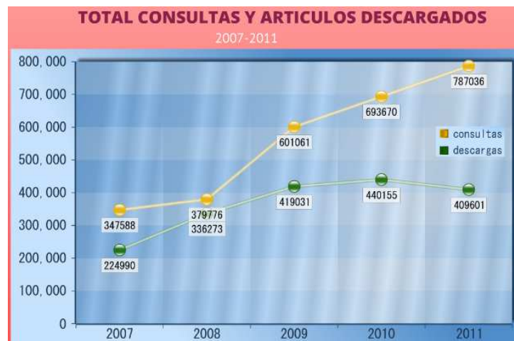
Consultas y descargas de artículos de revistas electrónicas suscritas a la DBUV

Para apoyar tecnológicamente las actividades académicas y de formación de sus usuarios, la DBUV ha dispuesto 107 computadores portátiles que se prestan semestralmente; 12 cubículos dotados de todos los insumos necesarios para el desarrollo de trabajos de grado o investigación, suscripción a 104 bases de datos bibliográficas; habilitación de tres mediatecas (dos para estudiantes y una para profesores) con 127 computadores de escritorio dotados de diademas, internet y aplicaciones de oficina; servicios virtuales tanto de referencia como de conmutación bibliográfica, una Biblioteca Digital Institucional y por supuesto un Portal Web con toda la información necesaria disponible en todo