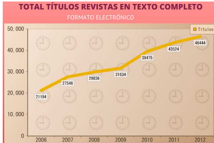
Revistas electrónicas en texto completo suscritas a la DBUV

vez son más aceptados y solicitados por la comunidad universitaria. En el 2012 el número de publicaciones seriadas electrónicas suscritas llegó a 46.444 donde está disponible una gran cantidad de artículos académicos y científicos con altos índices de consulta y descarga por parte de los usuarios.