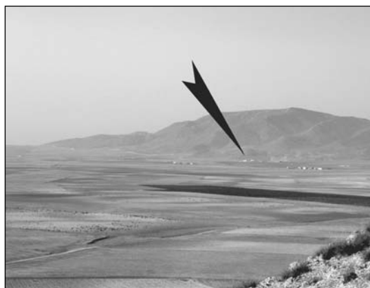
4. Cerro del Trigo (PDF-011). Visibilitat cap al sud-oest, on s'observa el santuari de Cerros del Curica (PDF-042).