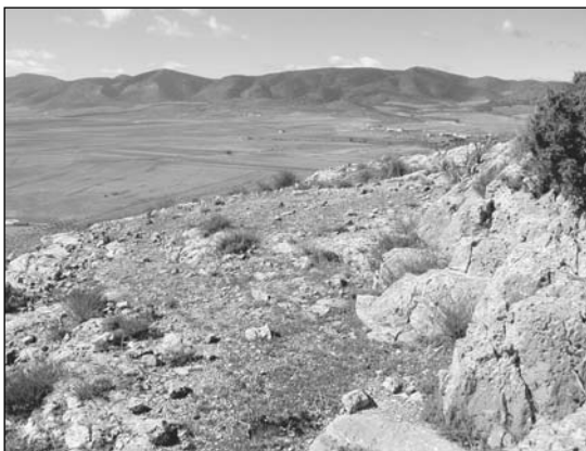
5. La Higuera (PDF-032). Vista de la terrassa per on s'estén el material ibèric, controlant el Campo de Bugéjar.