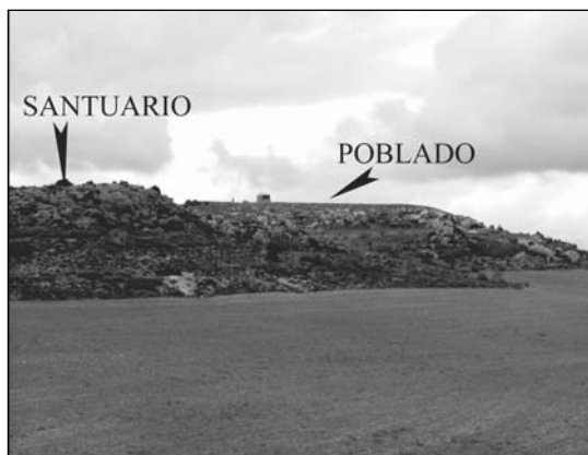
2. Cerro del Almendro (HCR-001). Situació del santuari en relació amb el poblat fortificat del mateix nom.