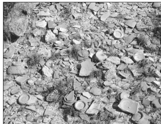
6. Cerro del Castillo (GLR-001). Detall d'una de les tres concentracions de materials ceràmics que presenta aquest jaciment, amb predomini de fons de plats.

d'un abandonament per defecte de cocción, haurien d'haver estat tirats pendent avall, amb la qual cosa encara ens allunyem més de l'entorn del riu. Per altra part, després de més de vint vi-