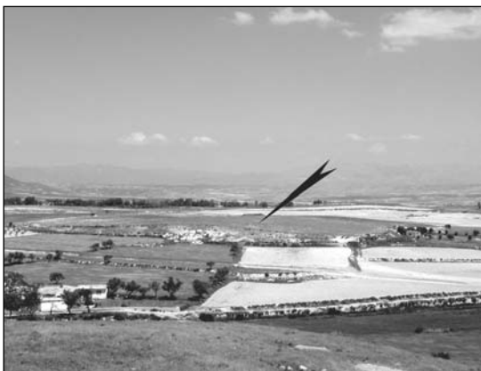
1. Cerro Largo 2 (BAZ-004). Vista aèria del santuari des de l' oppidum de Basti, inserit a la necròpolis del mateix nom (BAZ-003).