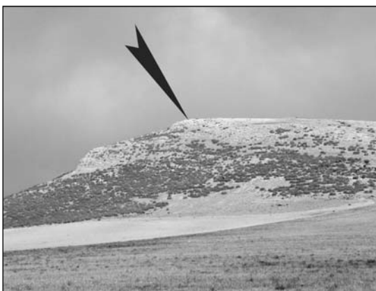
3. Cerro del Trigo (PDF-011). Vista del santuari territorial, situat en un turó al centre dels Llanos de Bugéjar.