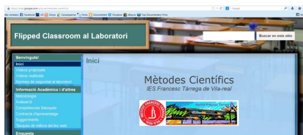
Figura 2. Lloc web de l'experiència didàctica

Se'ls comenta en què consisteix la metodologia "Flipped Classroom" i se'ls presenta el lloc web (figura 2). Es reparteixen les tasques a realitzar al web: Tasca d'edició de vídeos i fotos, Tasca de Manteniment i Millora del lloc web i Tasca de Correctors Lingüístics.